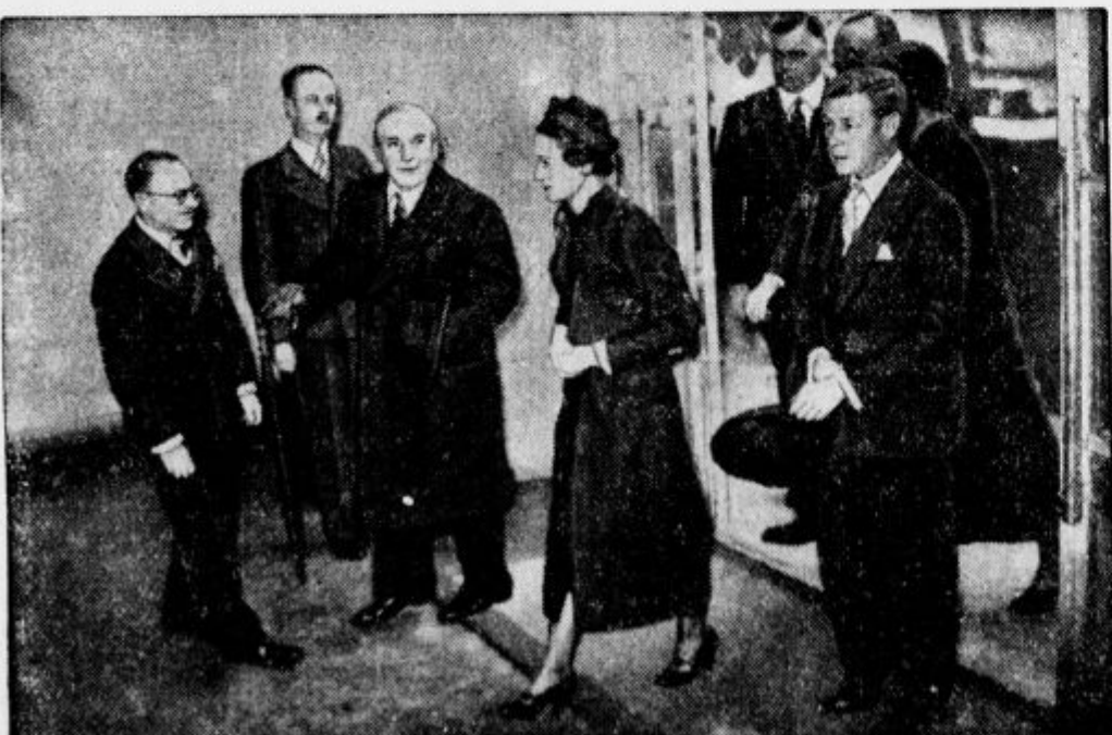
Vojvoda Windsorski si je s soprogo ogledal pariško razstavo in baje odpotuje tudi v Nemčijo.

Nekoč je zdravnik razkazoval blaznico nekemu mladeniču, ki je bil nesrečno zaljubljen. »Tu vidite človeka,« mu je dejal, »ki je zmeraj žalosten, ker ni dobil izvoljenke, ki jo je ljubil.« — Pri drugi celici sta zašlišala divjanje in ropotanje. Na vprašanje, kaj se ondi dogaja, je dejal zdravnik: »Ta je pa tisti, ki jo je dobil.«