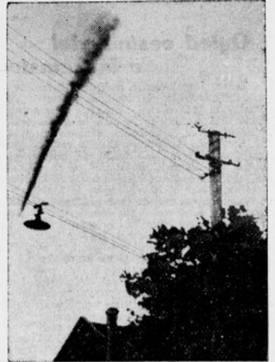
Goreči japonski bombnik nad Sangajem se pogreza iz višin na zemljo. Zadele so ga kitajske granate. Steber dima ga spremlja v pogubo.

Najmanjše živo bitje, kar jih poznamo, je d'Herellov »uničevalec bakterij«, ki je dobil ime po kanadskem znanstveniku, ki je odkril to bitje. To bitje je tako neznansko majceno, da ga človeško oko ne more zagledati niti z najboljšim drobnogledom in z najboljšim steklom. Spoznati ga moremo le po njegovem udeleževanju. Pri poskusih so opazili, kako so v kulturah bakterij začele izmenada izginjati bakterije, ko da jih preganja nekakšen nevidni sovražnik. Z bistroumnimi poskusi je d'Herell dognal, da ne uničuje bakterij kak strup, ampak pravo živo bitje, ki žre bakterije.