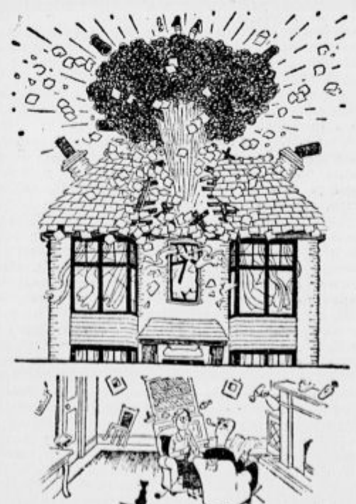
»Adolf, jaz mislim, da je že čas, da Gabrijelu prepoveš delati kemične poskuse!«

Olupiš 1 kg zelenih jabolč in jih razrežeš na kocke, za lesnik velike, ki jih koj poskropiš s sokom cele citrone. Jabolčne olupke in peške pomešaš z 2 kg grozdja (same jagode) in kuhaš in mešaš 20 minut. Nato vse precediš skozi sito. Sok, ki ga dobiš, prekuhaš z isto množino sladkorja in med kuhajo se mešaš. Nato dodaš jabolčne kocke in vse skupaj kuhaš kakih 15 minut, tako dolgo, da se zgosti. — Streeš v skledo in daš na hladno.