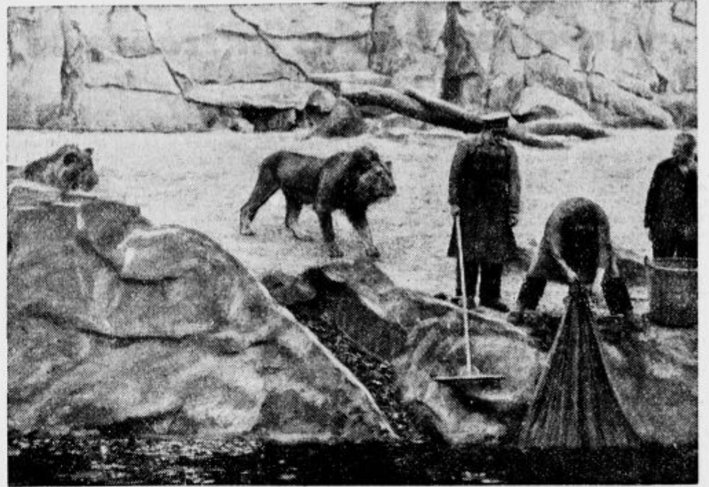
Na zoološkem vrtu v Berlinu začudeno opazuje »kralj živali«, kako čistijo jarke jesenskega listja.