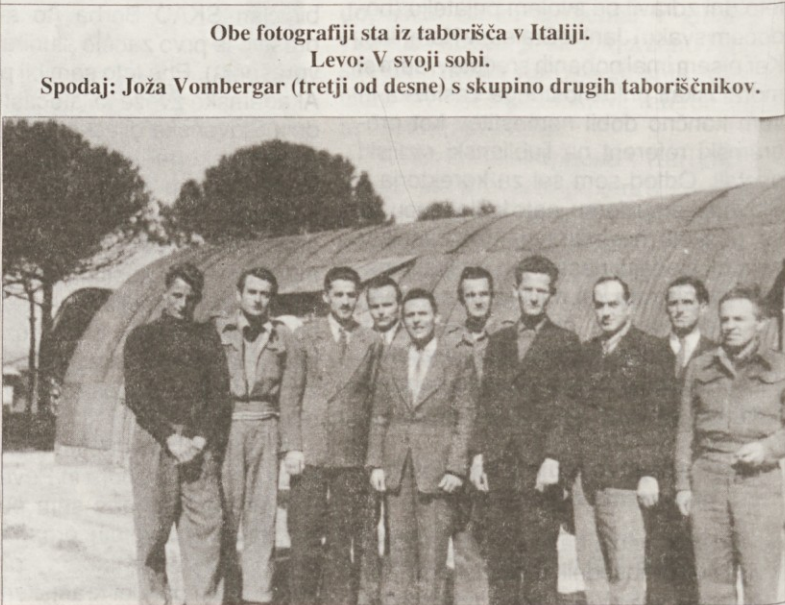
Obe fotografiji sta iz taborišča v Italiji.