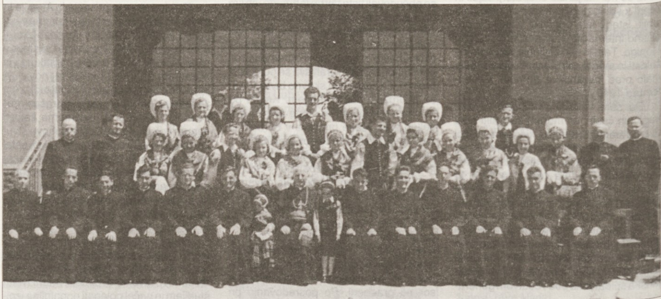
Škof Gregorij Rožman z enajstimi novomašniki na dan posvečenja, 13. januarja 1952, ob baziliki Marije Pomočnice kristjanov v Ramos Mejiji.