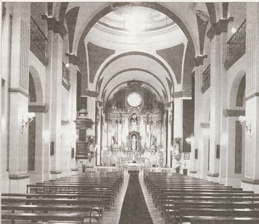
Notranjčina cerkve sv. Ignacija Lojolskega v Buenos Airesu

Slovenski: Da bi v naših župnijah zaživele molitvene, svetopisemske, mladinske, zakonske in druge skupine ter bi po svojih članih pričale za Jezusovo navzočnost med nami.