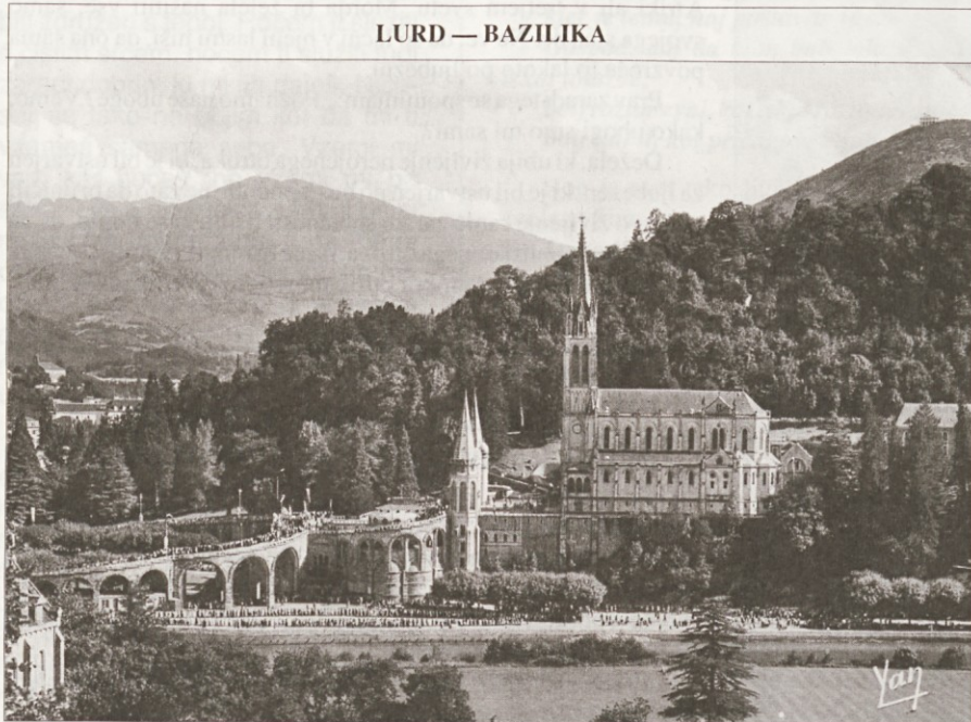
LURD — BAZILIKA

SVETO PISMO — V knjigarnah Združenih držav se je po 11. septembru 2001 zelo povečala prodaja Svetega pisma. ( Mladika )