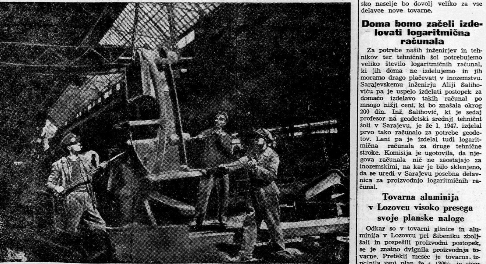
V veliki livarni tovarne težkih orodnih strojev nivo Lola Ribara v Zelezniku pri Beogradu vlijejo iz jekla tudi največje dele težkih orodnih strojev. Na sliki vidimo kako dvigajo pravkar vliji del velikega stroja

Odkar so v tovarni glince v aluminija v Lozovcu pri Sibeniku zboljšali in pospešili proizvodni postopek, se je znatno dvignila proizvodnja tovarne. Pretekli mesec je tovarna izpolnila svoj plan že s 130%, in sicer plan proizvodnje glince s 1140%, plan proizvodnje aluminija pa s 145,5%.