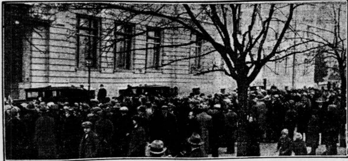
Nj. Vel. kralj in kraljica sta v Zagrebu obiskala tudi etnografski muzej. Ko sta se mudila v muzeju, se je na ulici zbrala velika množica ljudi, ki je kraljevski dvojec ob povratku iz muzeja priredila zopet velike ovacije.