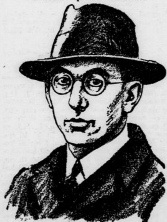
Vnuč švedskega kralja Gustava, ki se je nedavno poročil z damo iz meščanske stockholmske družbe.