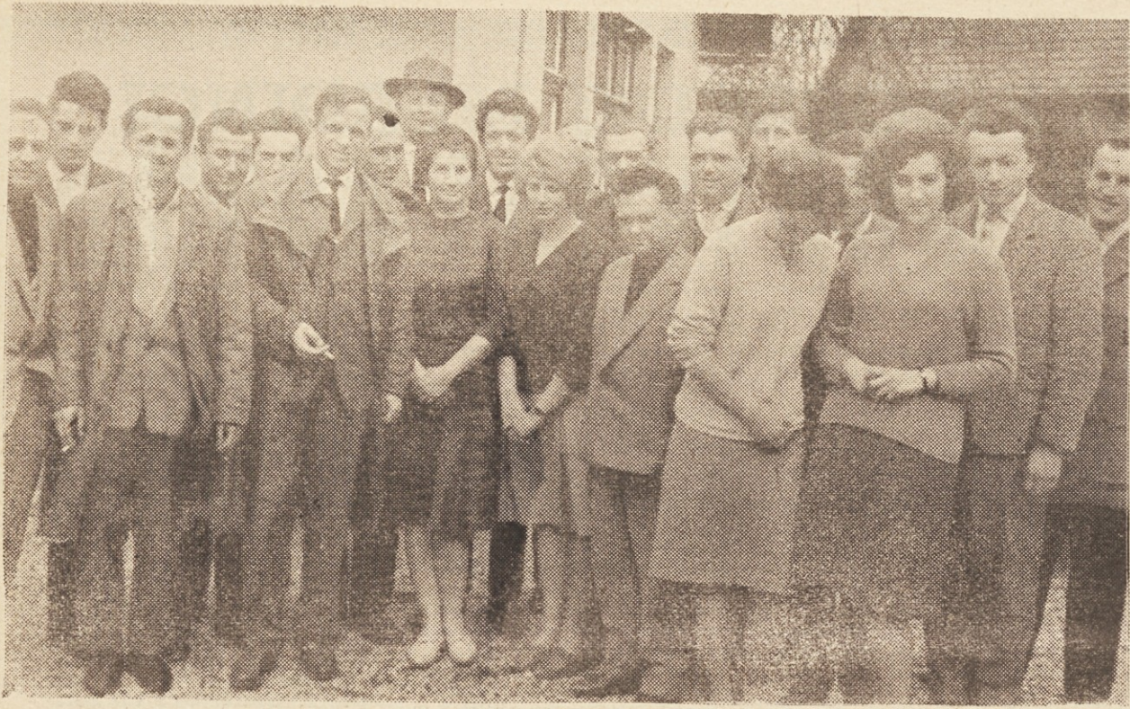
V okviru centra za izobraževanje je bil v Ljubljani organiziran tri-dnevni tečaj za nudenje prve pomoči. Na sliki del udeležencev seminarja