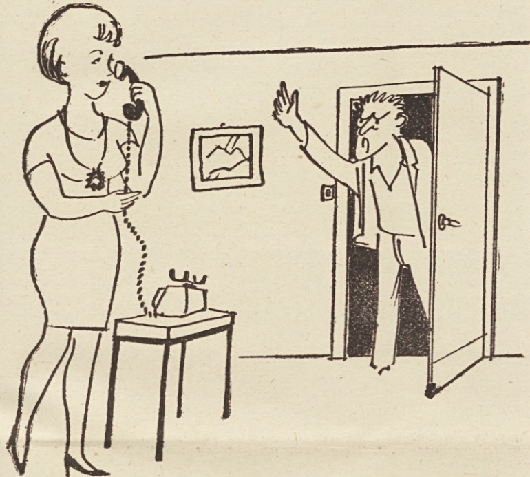
Mož ves razburjen: »Sedaj mi je pa dosti teh privatnih pogovorov, saj vendar nisi v podjetju!«