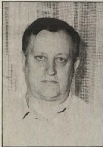
Avtor Tone Cevc