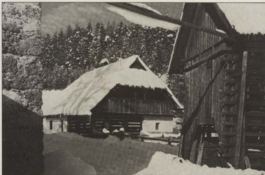
Primer starih hiš iz knjige: Leršnjakova hiša v Slovenjem Plajberku.

Zdaj je izšla tudi knjiga Kmečke hiše v Karavankah. V njej sta avtorja obdelala stavbno dediščino hribovskih kmetij pod Kepo, Stolom, Košuto, Obirjem, Pristovskim Storžičem in Peco. Gre torej za del obdelave obsežnega področja, katerega dolžina presega 100 kilometrov.