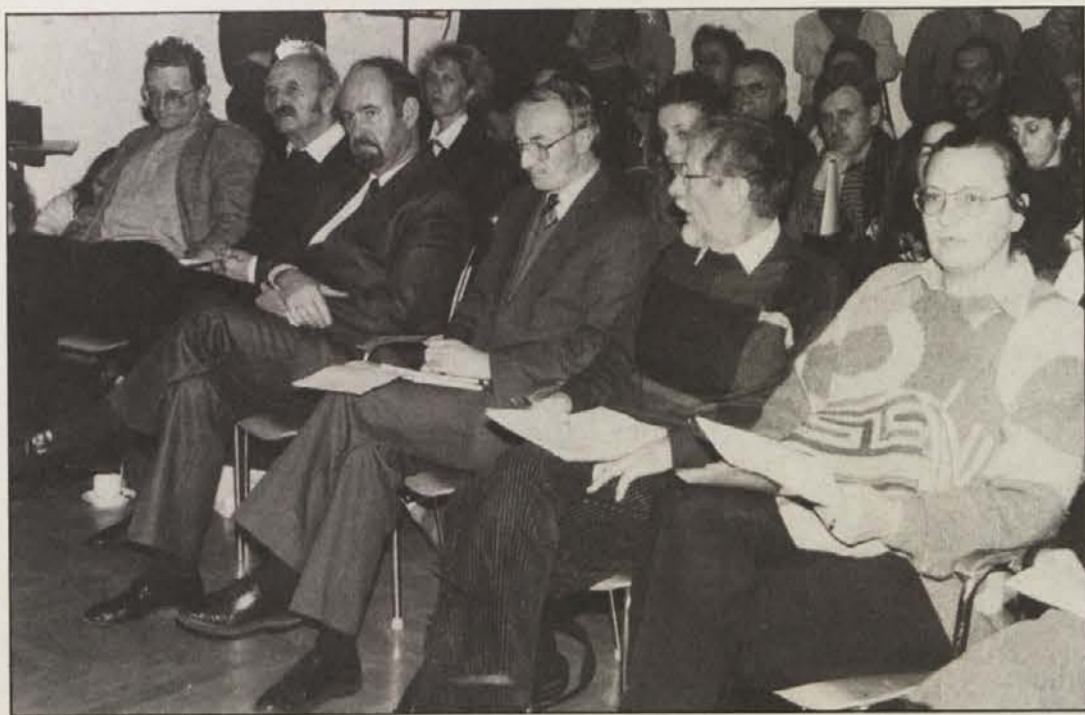
Gostje – pisatelji, ki so sodelovali na spominskem večeru Ericha Frieda.