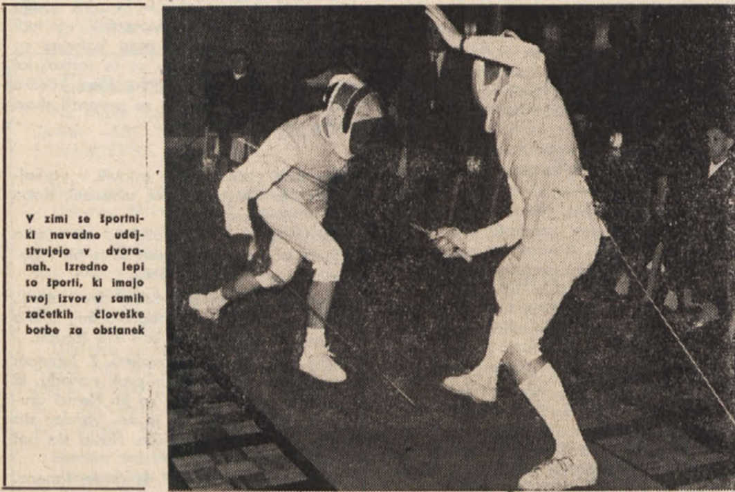
V zmiru se športniki navadno udeležujejo v dvoranah. Izredno lepi so športi, ki imajo svoj izvor v samih začetkih človeške borbe za obstanek

V prvenstveni tekmi je moštvo Št. Janža znova izgubilo 2 dragoceni točki. Na mokrem terenu se tekma sicer ni razvila do zaželjene kvalitete, vendar tokrat lahko ugotovimo, da sodnik, kakršen je bil na delu pri tem prvenstvenem srečanju, nikakor ni sposoben za opravljanje tako odgovornega posla. Moštvo Št. Janža, ki je v glavnem prevladovalo na igrišču, je moralo sprejeti 2 gola, ki sta bila dosežena v popolnem nasprotju z nogometnimi pravili. Gledalci so se športno zadržali, za kar pa je bilo ob takem sojenju treba precej močnega samoobvladanja.