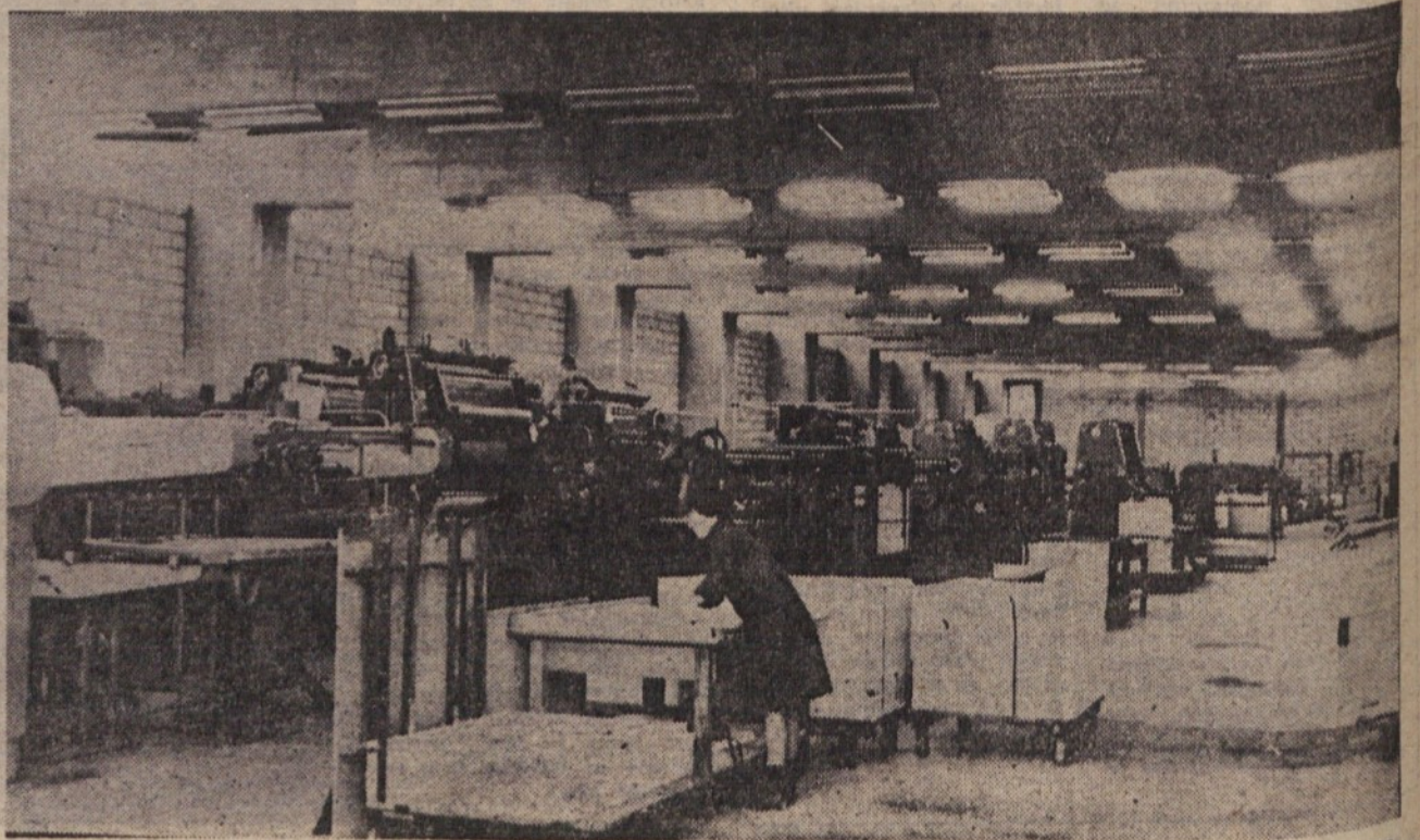
Obrat »Mladinske knjige« za Bežigradom