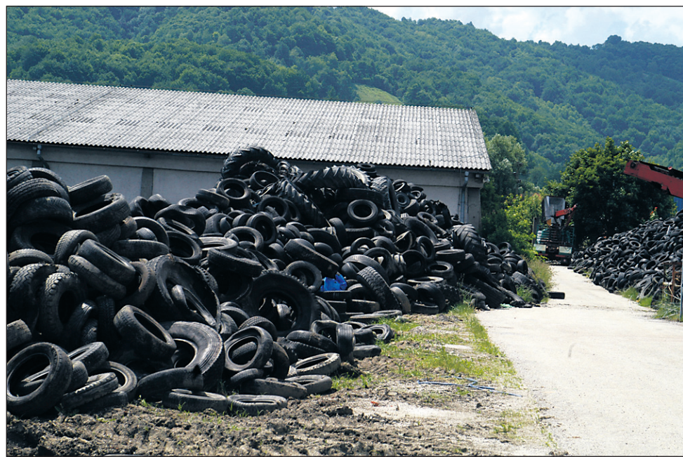
Na dvorišču majšperške tovarne je skladiščena večja količina odpadnih avtomobilskih gum, ki jih zaradi prestroglj domačih predpisov vozijo na predelavo v sosednjo Avstrijo.