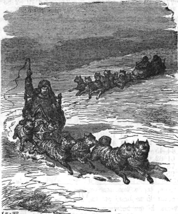
K. At. v. W.P.

Kamčatska zemlja je pokrita z več snegom in ledom, zato rej ondu ne more konj opravljati onega posla, kakor pri nas. Ali dobri Bog tudi Kamčadalcev nij pozabil. Kar je nam konj, to je tem prebivalcem pes, ki je baš po onem polu-