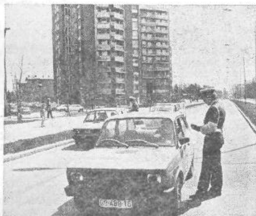
Obvozi zaradi zapore križišča pa so povzročili dodatno zmedo in marsikateri voznik ji ni bil kos. Marsikdaj tudi opozorila niso zalegla...