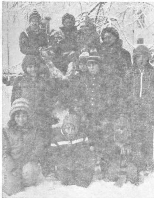
Deset šolarjev iz Krajevne skupnosti Donja Vežica, s katero je pobratena Krajevna skupnost Ljubo Sercer, je zimske počitnice preživel v Ljubnem. Med bivanjem na Gorenjskem so si reški gostje ogledali tudi muzej NOV v Begunjah, od koder je tudi naš zapozneli posnetek.