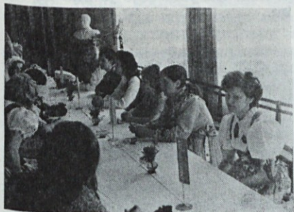
V dvorani nad jedilnico