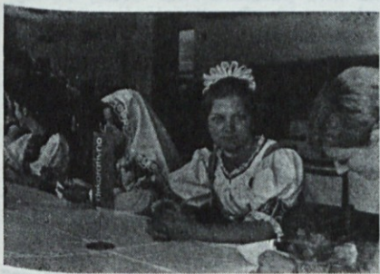
Slovaška nevesta — »lepota dneva«