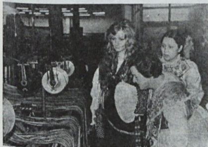
Slovenka, Avstrijka in Svicarka

Praden nas je pisana skupina deklet s spremstvom zapustila, je vsaka od nevest dobila v dar še po eno našo okrasno blazinico.