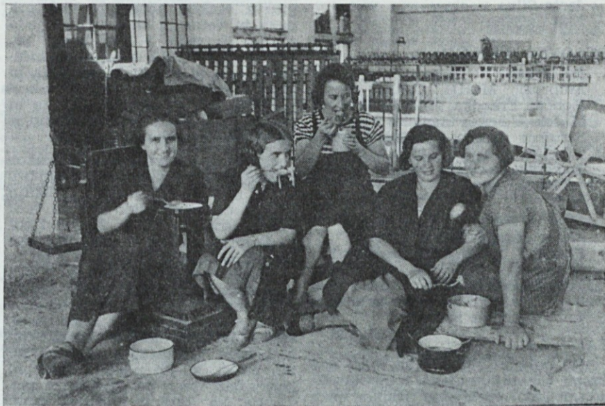
Malica pri »Eiflerju«