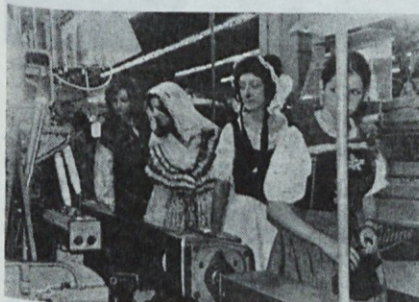
Veseli sprevod med stroji