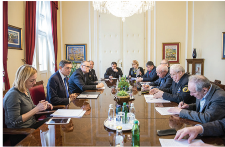
Pogovor pri predsedniku republike

Zahtevamo jasno in javno obsodbo takšnega moralno in etično nedostojnega početja. Demokracija se meri tudi in predvsem po učinkovitem delovanju pravne države, po spoštovanju človekovih pravic