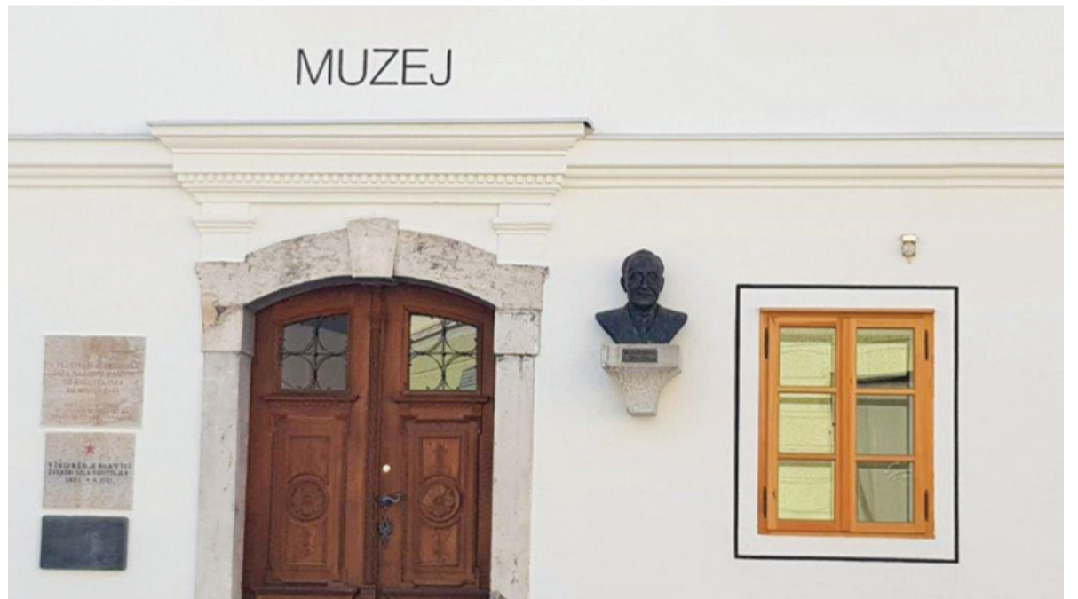
V spomin na svojega krajana v Semiču že tradicionalno prirejajo Krakarjeve dneve, na pročelju muzeja pa stoji njegov doprni kip.

Rodil se je 21. februarja 1926 v Semiču v Beli krajini, umrl pa 24. decembra 1995 v Ljubljani. Po končani osnovni šoli v Semiču je obiskoval gimnazijo v Novem mestu, kjer pa je šolanje prekinil, saj so ga najprej zaprli Italijani, nato pa internirali tudi Nemci. Gimnazijo je dokončal po koncu vojne in se je v Ljubljani vpisal na študij slavistike na Filozofski fakulteti. Po diplomi je odšel v Varšavo študirat polonistiko, po letu 1965 pa poučevat slovensko književnost in slovenski jezik na Univerzo J. W. Goetheja v Frankfurtu, kjer je leta 1970 tudi doktoriral.