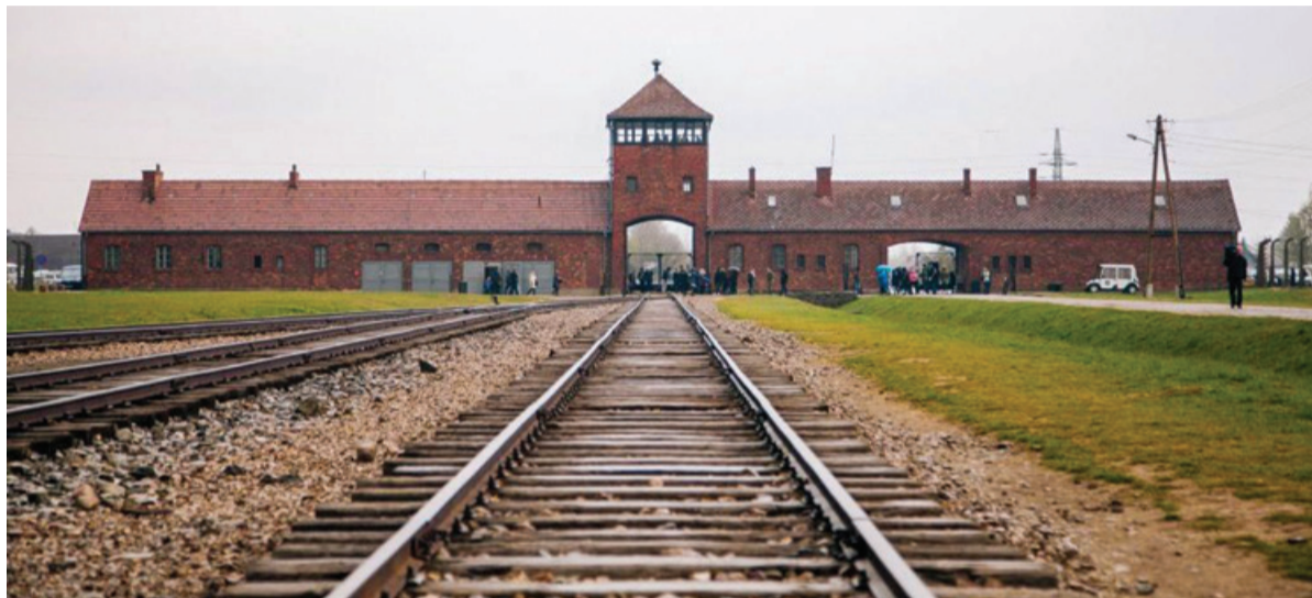
Spominski muzej v Auschwitzu je lani obiskalo 2,3 milijona ljudi.

dejstva ter razsežnost iztrebljanja Judov, to je šoe oziroma holokavsta, ki so ga nacisti in njihovi pomagači izvedli med drugo svetovno vojno. Zanikati holokavst konkretno pomeni trditi, da se ta ni zgodil, pa tudi javno zanikati ali dvomiti, da so se ključni načini iztrebljanja (npr. plinske celice, množični poboji, stradanje, mučenje) resnično uporabljali ali da je bil genocid nad Judi nameren. Različni načini zanikanja holokavsta so izraz antisemitizma, ocenjujejo v mednarodni zvezi za spomin na holokavst