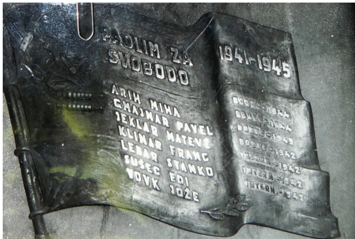
V Jeseniški muzej so prinesli v hrambo plošče s porušeni objekti jeseniške železarne. Tam se je za njimi izgubila sled, ostale so le fotografije

Vpisi partizanskih spomenikov na Geopediji pridejo prav, ko zlikovci katerega izmed njih odstranijo. Rušenje spomenikov se je dogajalo okrog osamosvojitve Slovenije, ki so jo nekateri razumeli kot zapozneli konec druge svetovne vojne in kot zmago nad partizani. Vandali-