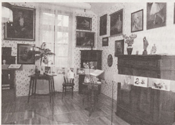
"Ciklus ljudskih noš", Akvareli Saše Šantla.

8. aprila smo odprli razstavo fotografij z naslovom Hommage svetovnemu dnevu Romov .