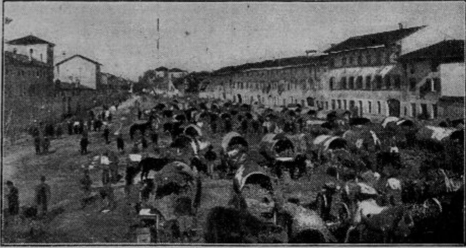
Komora slovenskega polka gorskih strelcev št. 2 v Rivignanu ob Tilmentu.

Italija se je že takoj od izbruha svetovne vojne poleti sistematično pripravljala, da zahrbtno napade svojega dolgoletnega zaveznika, ker za njo niso bile merodajne zvezne pogodbe.