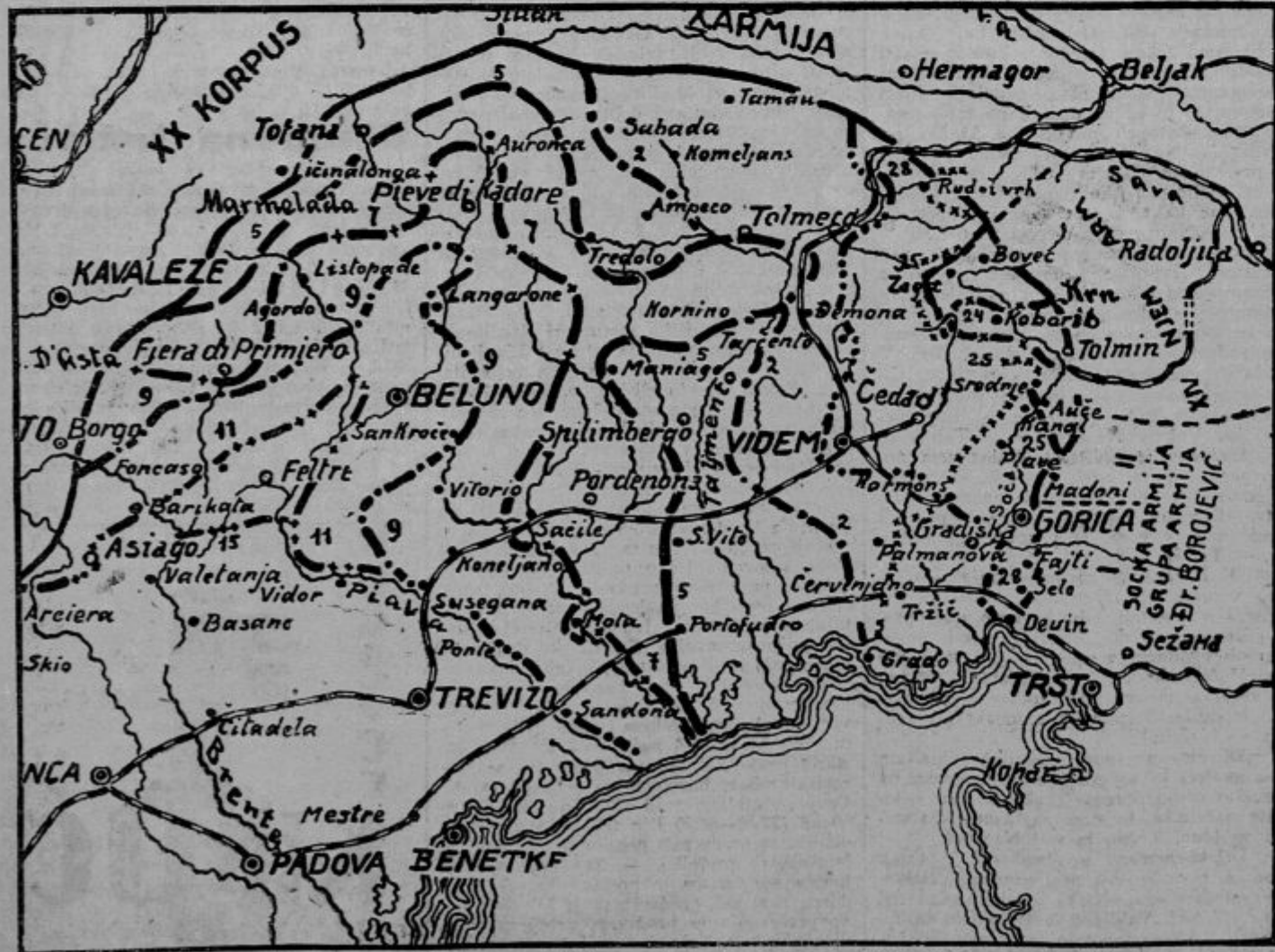
Prikaz prodiranja avstrijsko-nemških probojnih čet od Kobarida proti Piavi.

Za ofenzivo na navedenem prostoru je bilo določenih 7 nemških in 6 avstro-ogrskih divizij z različnih, večinoma vzhodnih (rusko-rumunskih) front. Na artiljerijskih ojačenjih je prišlo v ta prostor vsega 1452 topov različnega kalibra s približno 1 milijonom komadov artiljerijske municije, zopet največ iz vzhodne fronte. Vsa ta artiljerija je bila dne 20. oktobra že na svojih odsekih. Primerno so se pomnožile tudi tehnične, sanitetne in intendantske čete in naprave, kakor tudi etapni in žandarmerijski oddelki. Samo na končico ni nikdo mislil, kar se je pozneje ob Piavi bridko maščevalo, toda tako da-leč centralne sile niso računale, saj je bil cilj napada Cedad, največ Tagli-