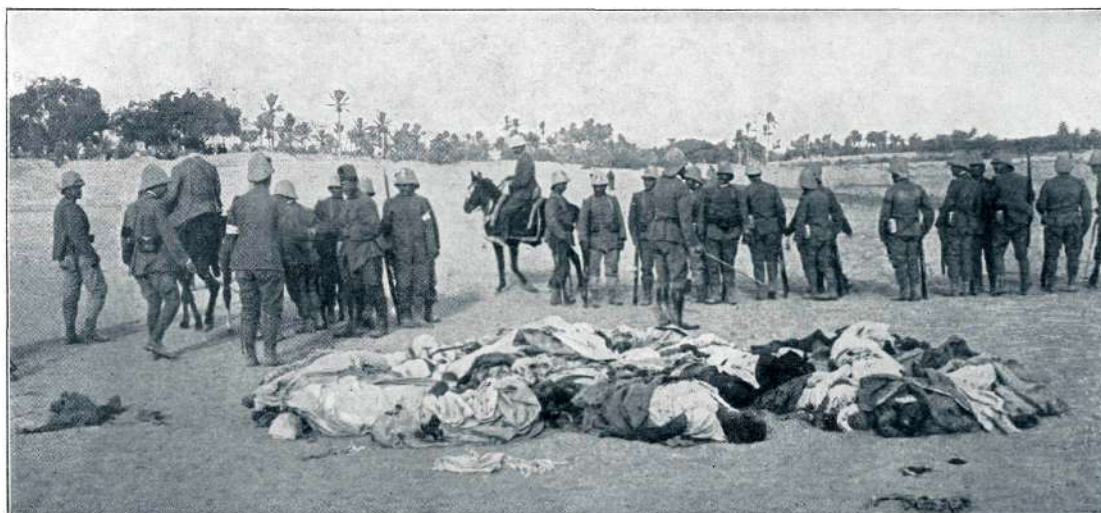
Z BOJIŠČA: OD ITALIJANSKIH VOJAKOV POSTRELJENI ARABCI.

V Monakovem so zasnovali koncem l. 1909. eminentno kulturno delo. „Splošna zveza za krščansko umetnost“ („Allgemeine Vereinigung für christliche Kunst“) je začela izdajati pod geslom „Umetnost ljudstvu!“ („Die Kunst dem Volke!“) poljudne monografije o umetnosti. Njen namen je popularizirati pravo, lepo, srce blažečo in dvigujočo umetnost in tako obvarovati ljudsko dušo pred osladno in čestokrat razbrzdano laži-umetnostjo naših dni, ki tudi izkuša vse preplaviti in — zastrupiti. To je plemenit, visok cilj: krščanska vzgoja in izobrazba najširših ljudskih slojev