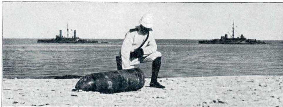
Z BOJIŠČA: PRVA ITALIJANSKA GRANATA NA TRIPOLIŠKIH TLEH.

za naravnost pretirane cene iz Amerike ali pa morebiti iz Nemčije. Angleška admiraliteta pokupuje že sedaj vse zaloge premoga, ki jih more dobiti, kajti v normalnih razmerah zadostujejo zaloge mornarice komaj za 14 dni. Nekoliko so že poizkušali na Angleškem posledice take stavke leta 1893., ko so ustavili obrat premogovniki v Yorkshire, Lancashire, Notinghamshire, Derbyshire, Warshire in Staffordshire. V Londonu so takrat plačevali 5 kron za stot premoga. Ako bo trajala stavka premogarjev dalje časa, bo čez nekaj tednov