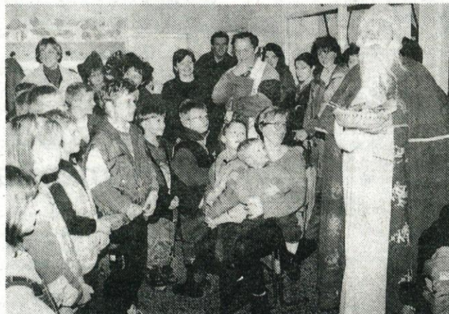
Božiček je s svojim prihodom razveselil tako najmlajše, kot tudi malo manj mlade.