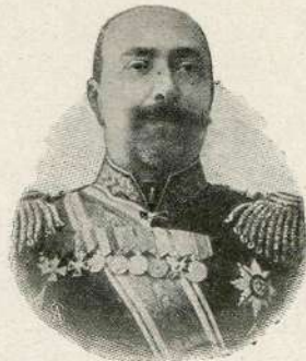
General Stössel, bivši poveljnik v Port Arturju.

Novi maloruski časopisi. Začetkom novembra je začel izhajati v Vinipegu (v Kanadi) nov poljuden maloruski tednik pod naslovom „Kanadijskij farmer. Časopis dlja ruskogo naroda v Kanadi.“ Novi tednik se tiska s fonetičnim pravopisom. Naročnina (na leto) znaša v Evropi 1-50 dol. (K 7-50). — V Tarnopolu