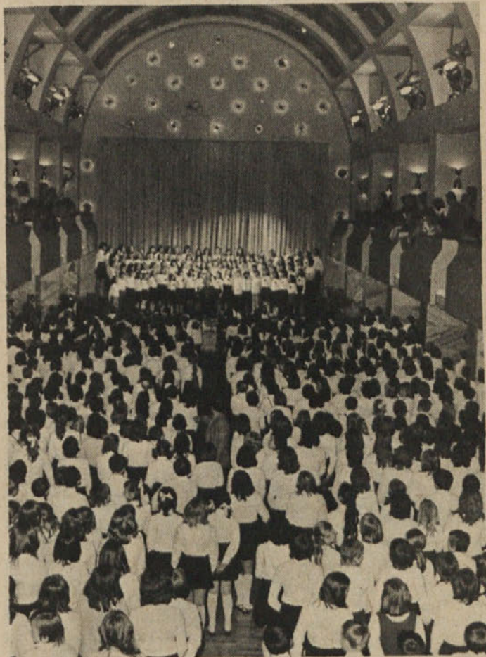
Letošnje srečanje otroških in mladinskih pevskih zborov iz občine Moste-Polje je bilo v Festivalni dvorani. Nastopilo je kar 750 mladih pevcev.