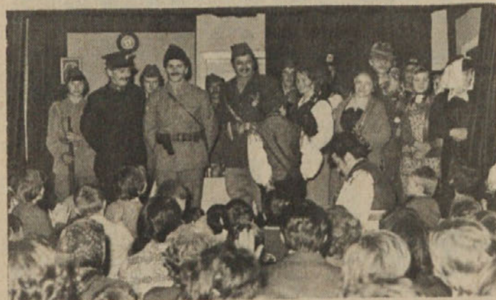
Gledališka ljubiteljska dejavnost je v občini Moste-Polje kljub porabniški miselnosti, ki nas ogroža zelo razvejana. KUD France Prešeren iz Javora je z uspehom uprizorilo Borove Raztrgance.

– imajo pravico zahtevati od organov skupnosti in njene strokovne službe ter od temeljnih samoupravnih organizacij in skupnosti, v katerih so bili delegirani, podatke, ki so jim potrebni za njihovo delo v skupnosti;