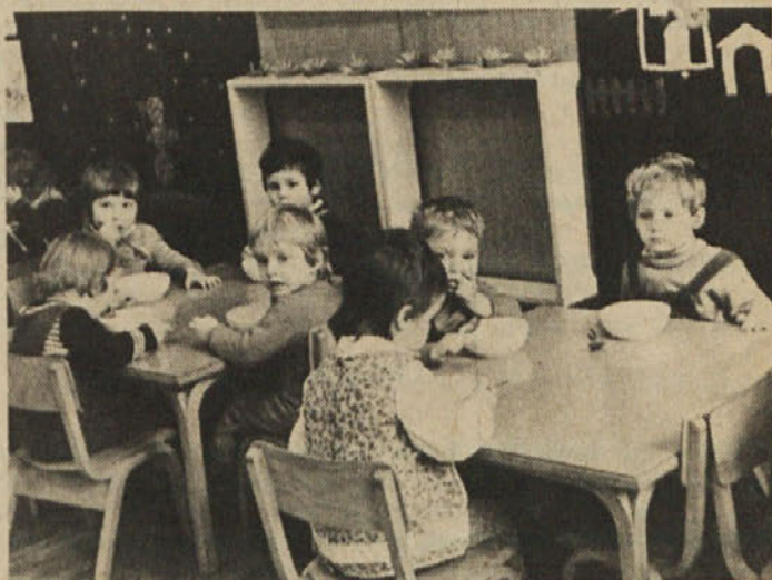
Vrtec v Polju: kako prijetno tekne malica