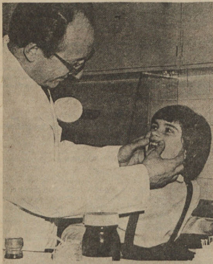
Tudi zdravstvena in zobozdravstvena služba delujeta v utesnjenih prostorih. Zdravstveni dom Moste je bil namreč grajen za potrebe pred desetimi leti.

Za kar najbolj neposredno uresničevanje samoupravnih pravic in interesov imamo delavci in drugi delovni ljudje ter naše organizacije združenega dela in druge samoupravne organizacije in skupnosti, ki sestavljajo to občinsko zdravstveno skupnost, pravico, da se organiziramo v enote za območje krajevnih skupnosti ali za posamezne večje in še zlasti sestavljene organizacije združenega dela. V taki enoti uresničujemo določene samoupravne pravice in interese v okvirih po tem samoupravnem