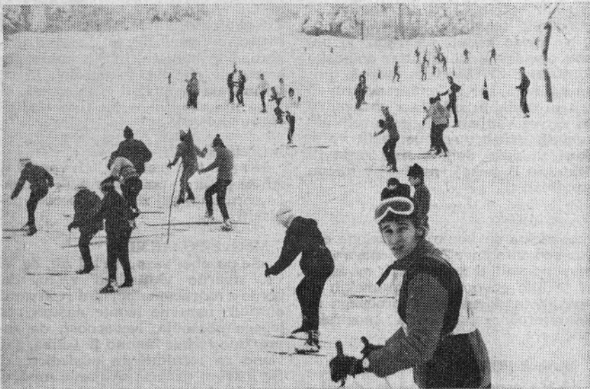
Na tekmo vatnju je startalo 58 tekmovalcev

mlajši mladinci 1. MA Gornji grad 2. MA »Smreka« Gornji grad