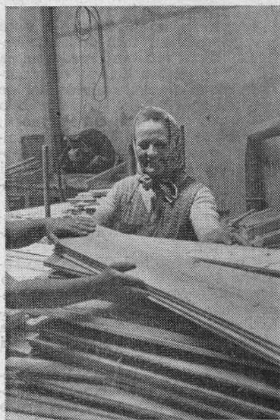
Takšnega in podobnega dela bo v Nazarjah čedalje manj

sredstvi, morajo imeti povsem enak družbeno gospodarski položaj in načelno enake pravice ter obveznosti, kakor delavci, ki delajo v združenem delu z družbenimi sredstvi.