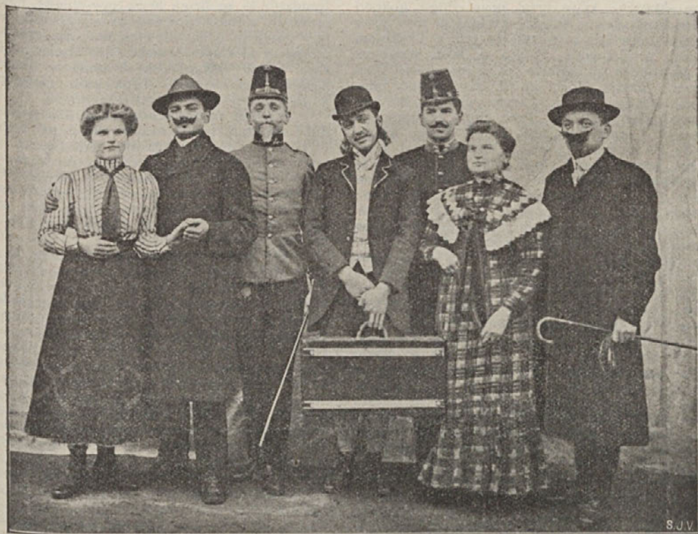
4 2 1 6 7 3 5 igralci „Gosp. braln. društva v Kozjem“ 12. svečana 1911.