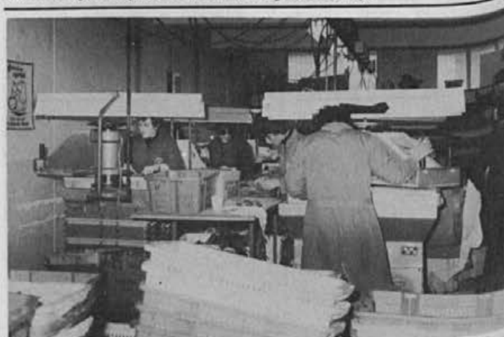
Gneča v Gorenji vasi — kako dolgo še

V soboto, 1. junija je Alpino v spremstvu predstavnikov občinskega sveta Zveze sindikatov obiskala delegacija iz obratene občine Smederevska Palanka. Predstavniki gospodarskega in družbenopolitičnega življenja te občine so si z zanimanjem ogledali tudi našo proizvodnjo