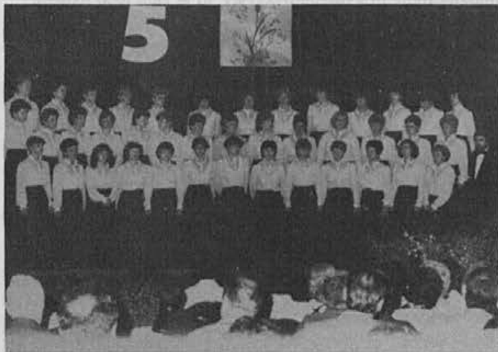
Uspešen nastop pevk ob peti obletnici dela

Čestitke ob peti obletnici uspešnega delovanja