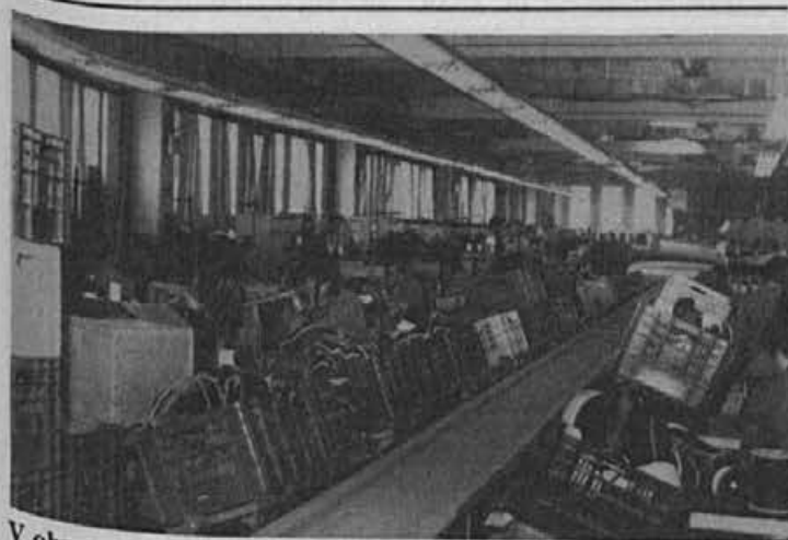
V obratu na Colu bodo kmalu zaokrožili delovni proces