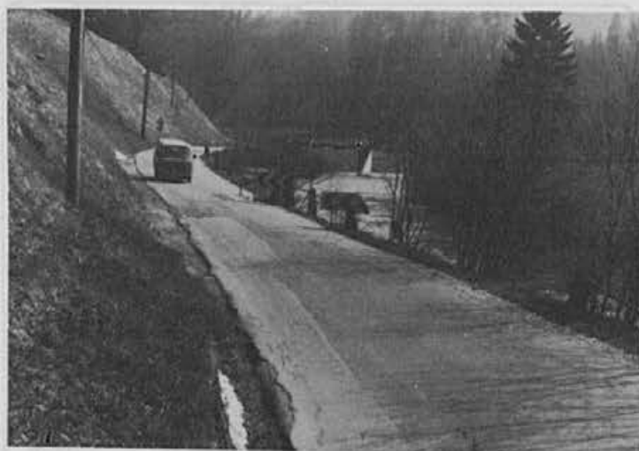
Trebijska cesta »vpije« po popravilu

V vajo se je vključila tudi ekipa Radia Žiri, ki je delovala na rezervni lokaciji