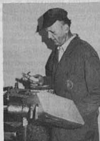
Izdelano sekalo je treba še zvariti

Je pa to delo dokaj naporno, ker zelo trpijo roke, tako da jih včasih ob dveh komaj dvigneš. Tresljaji so tu neprestano, posebno hudi so, če delava višja sekala za sekanje podplatov, ki so tudi iz debelejšega materiala. Druga neugodnost je hrup, tako da sva že pomalem gluha. Zaradi takih pogojev greva vsakih nekaj let tudi na kontrolni pregled, kar pa ne pomaga veliko; samo upava lahko, da ne bova na stara leta čutila posledic. Neprijetno je tudi to, da ne moreva imeti rokavic, ker