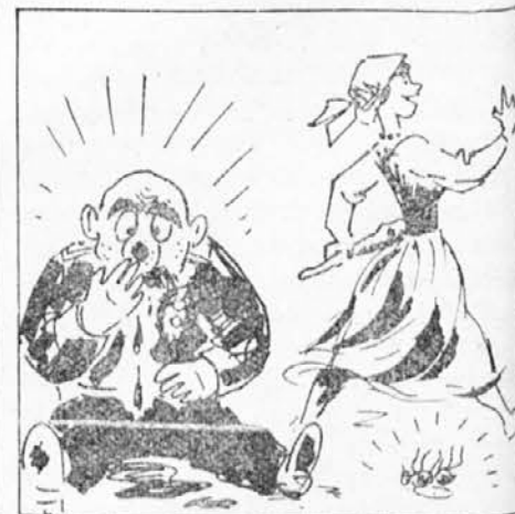
belo buško na nosu na tla, žena se je pa veselo smejala, ker je muho kaznovala.