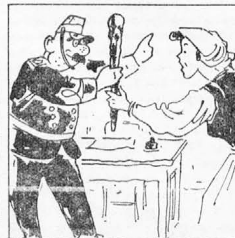
vedala svojo nesrečo, ji je dal sodnik debelo palico, rekoč ji, naj muho pretepe.