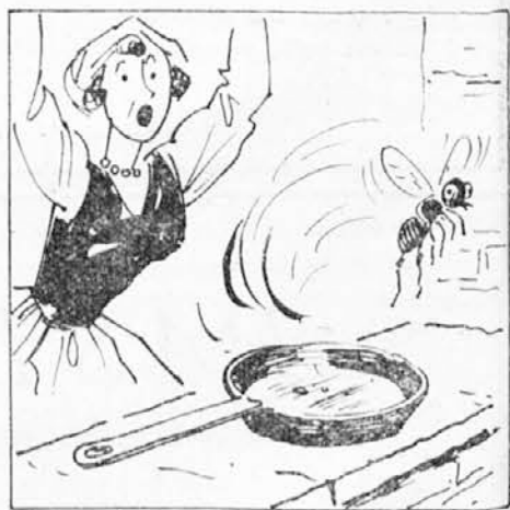
je ponvica prazna, je muha že odletela in zato je ni mogla kaznovati. Kaj storiti!