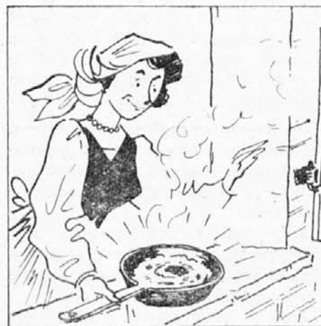
Nekega dne je postavila komaj pečeno cvrtje na okno, da bi se ohladilo. A glej,