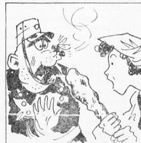
V tistem trenutku je priletela muha in sedla prav na sodnikov nos. Žena je brž