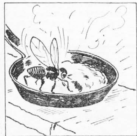
priletela je požrešna muha in pojedla ženi vse cvrtje. Ko je žena zagledala, da