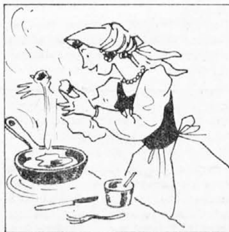
ce. Vsak dan si je spekla cvrtje za kosilo in tako je srečno živela v svoji hišici.