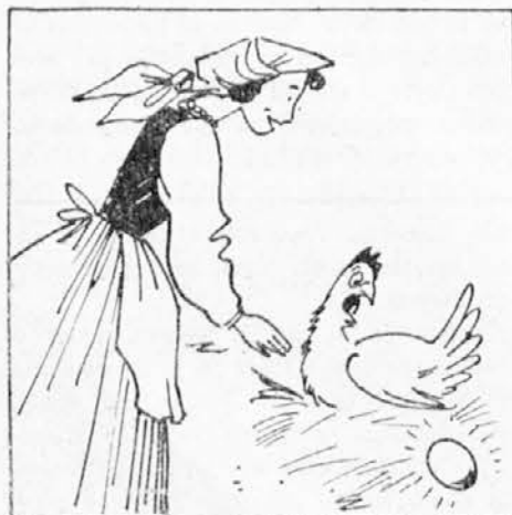
Bila je revna žena, ki je imela eno samo kokoš in ta ji je vsak dan znesla jaj-