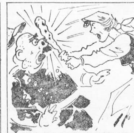
udarila po sodnikovem nosu in tako kaznovala muho. Sodnik se je zgrudil z de-