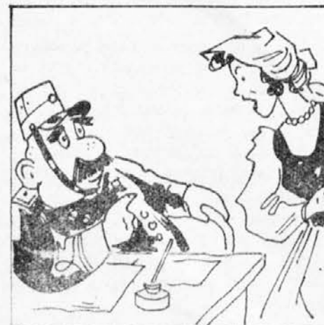
ti! Odpravila se je k vaškemu sodniku, da bi kaznoval tatoco. Ko mu je žena po-