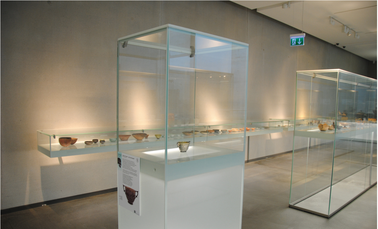
Abb. 2: Archäologiemuseum am Universalmuseum Joanneum. Silberbecher aus Groß St. Florian. Sl. 2: Arheološka zbirka Univerzalnega muzeja Joanej iz Gradca. Srebrna čaša iz Sv. Florijana ob Laznici.

beobachtet. Dagegen wird aber nicht gesagt, warum die Helme „Negauer Helme“ heißen. Dies erfährt der Besucher nur in einem sehr schönen Katalog mit informativen Texten. 41 Wenn das Museum ein Speicher oder ein Generator von Wissen sein ist, sollte dann nicht der Besucher auch die grundlegenden Informationen vor Ort bekommen? In gekürzter Form wäre der Text für die Vitrine geeignet und geht über die allgemeinen Bemerkungen der zitierten Beschriftung hinaus. Die große Herausforderung an den Ausstellungsplaner ist nicht allein die ästhetische Präsentation der Objekte, sondern die angemessene Verbindung von Präsentation und allgemein verständlicher Information. Die fast beschriftungsfreie Museumsgestaltung hatte man nach den Siebzigerjahren überwunden geglaubt.