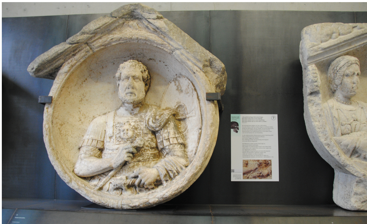
Abb. 3: Archäologiemuseum am Universalmuseum Joanneum. Römersteinsammlung, Detail. Sl. 3: Arheološka zbirka Univerzalnega muzeja Joane iz Gradca. Rimski lapidarij, detalj.

Menschen erkennen und daraus Identität ableiten können. Gerade archäologische Sammlungen haben dabei den unschätzbaren Vorteil, anhand authentischer Hinterlassenschaften die dahinter stehenden Menschen angreifbar zu machen und daraus die Spannung zwischen Vergangenheit