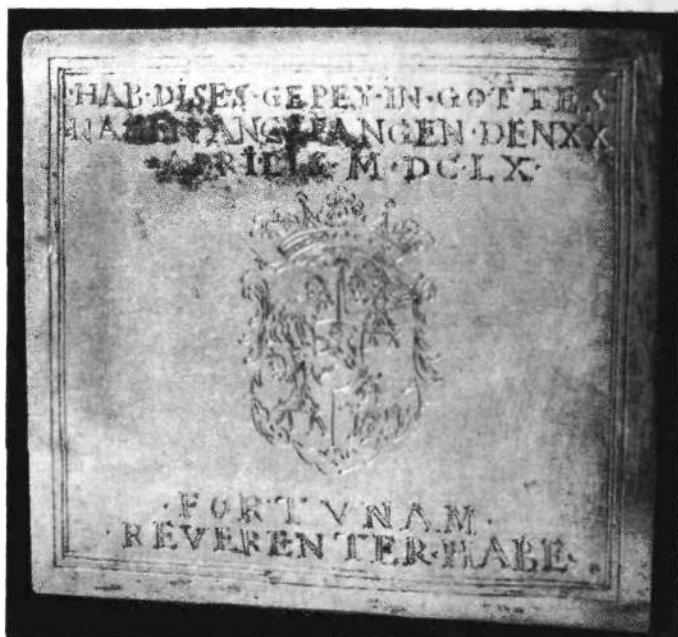
Pozlačena plošča, ki so jo našli pri zidanju univerzitetne knjižnice v temeljnih zidovih nekdanjega Knežjega dvorca

RER · WIE · AVCH · DER · RÖM · KAY : MAY : GEHAIMBER · RATH · VERORDENTER · AMBTSPRÄ- SIDENT · VND · LANDTSHAUBTMAN · · IN · CRAIN · · HAB · DISES · GEBEY · IN · GOTTES · NAMEN · ANGEFANGEN · DEN XX · APRILIS · M · DC · LX · · FORTVNAM · · REVERENTER · HABE ·