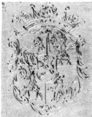
Grb, ki je z izredno natančnostjo vrezan v drugo stran plošče