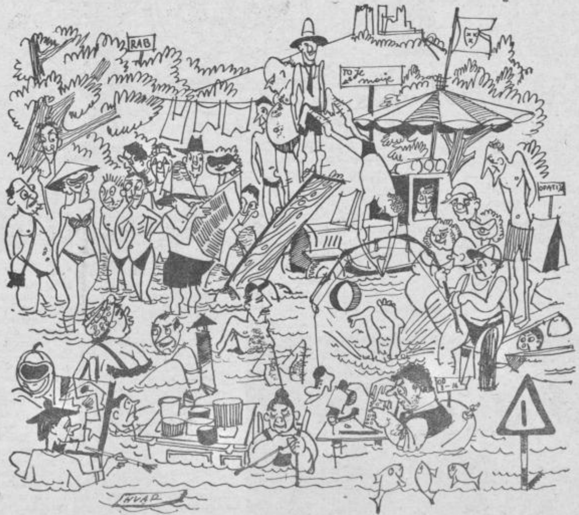
(Improvizacija na dano temo)

Zadnje čase posijalo sonce je že spet močnejše, da Celjani so zdrveli to nedeljo na obalo — vsaki si vneto ude greje. Teti Katri je prevročje »šopherte« na Savinjo zvrleče,