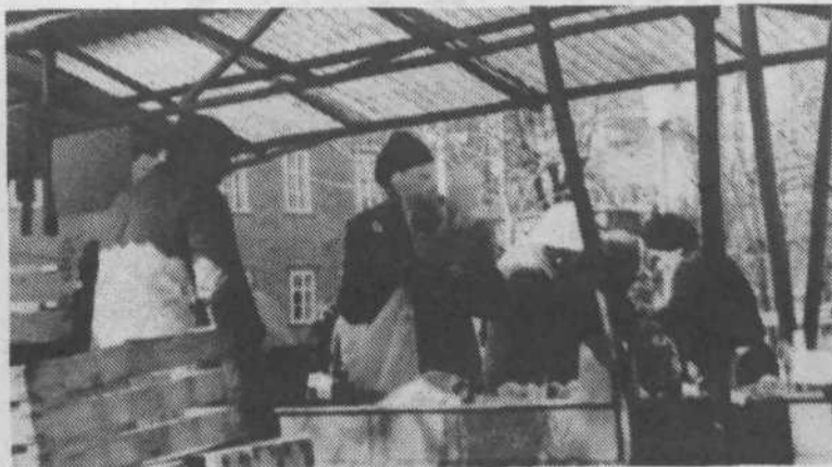
1. Pravzaprav sodi tudi ta slika k 8. marcu. Marsikateri malo bolj praktičen moški je ženi, poleg obveznega šopka, kupil tudi četrt, ali celo pol kilograma radiča. Konec koncev je vsaj del te dragocene dobrine pristal v njegovem želodcu.