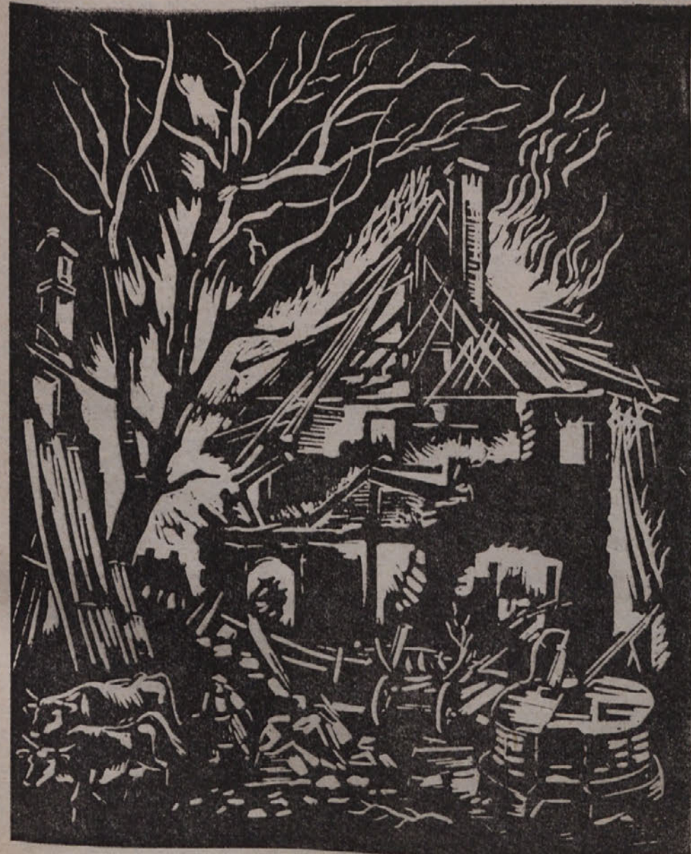
VIDMAR DFAGO: V plamenu, linorez