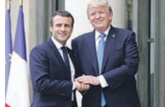
Trump je gostil prvi državniški obisk, odkar je na položaju.

V Državnem zboru se je zgodilo pričakovano. Izredne seje ni bilo, saj so poslanci zavrnili dnevni red, po katerem bi morali obravnavati 14 zakonskih predlogov.