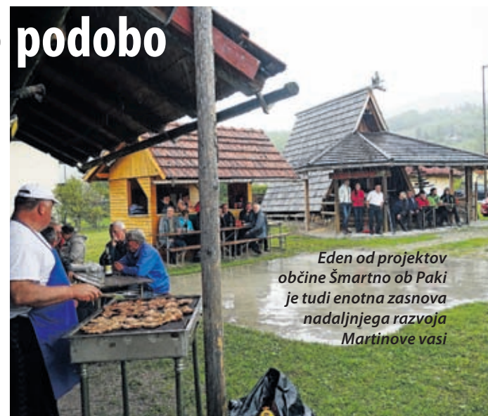
Eden od projektov občine Šmartno ob Paki je tudi enotna zasnova nadaljnega razvoja Martinove vasi