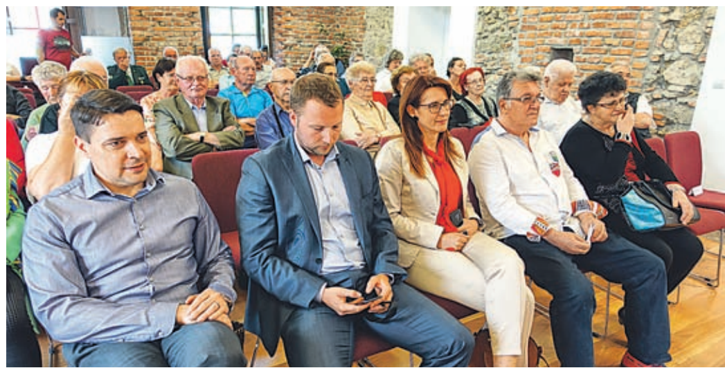
Zbrani v dvorani so pobude podprli in se strinjali, da bi jih morali glasno zahtevati že veliko prej

Govorili so tudi o skrunitvi partizanskih spomenikov, pri tem pa z zadovoljstvom ugotavljali, da tega v tem okolju ne beležijo. Seveda si želijo čim večjo podporo oziroma podpis peticije, kar je možno narediti na njihovi spletni strani.