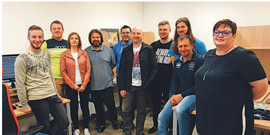
»Naše delo ni nikoli zaključeno, saj smo zavezani stalnim izboljšavam in inovacijam,« zagotavljajo zaposleni v podjetju PIA Velenje. Na sliki del ekipe.

zakonodajnim spremembam. V 5-letnem programu pa smo predvideli razvoj povsem nove verzije produkta ODOS sistema za upravljanje dokumentov in procesov, na novi platformi, z novo arhitekturo, ki bo tehnološko primerna tudi za implementacijo