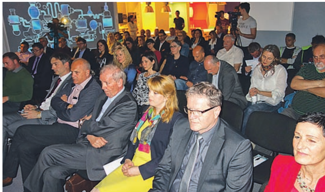
Temo razvojne konference so označili kot »razpravo o naši prihodnosti s poudarkom na človeškem kapitalu«

Velenje, 19. aprila – V Vzorčnem mestu v Velenju so Savinjsko-šaleška gospodarska zbornica, Območna razvojna agencija Saša, Andragoški zavod Ljudska univerza Velenje, Center za razvoj terciarnega izobraževanja Saša Velenje in tukajšnja območna služba Zavoda RS za zaposlovanje pripravili razvojno konferenco. Na njej so predstavniki gospodarstva, šolstva, lokalnih skupnosti, nevladnih organizacij z več zornih kotov