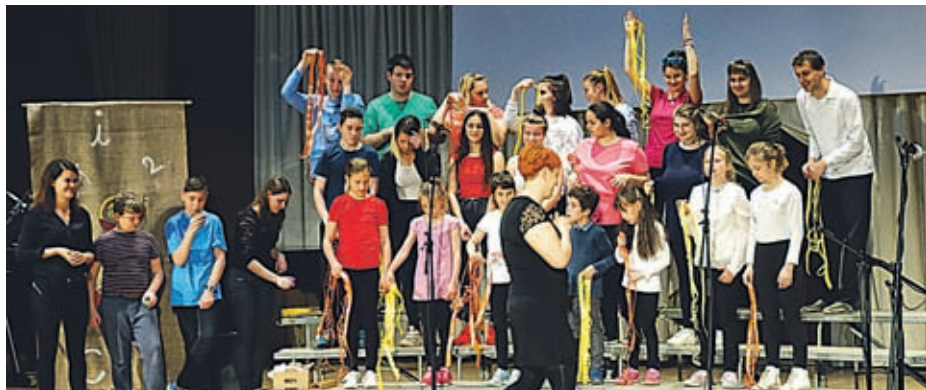
Na odru velenjske glasbene šole so nastopile plesne skupine in zbori. Na sliki zbor Il. Osnovne šole Žalec