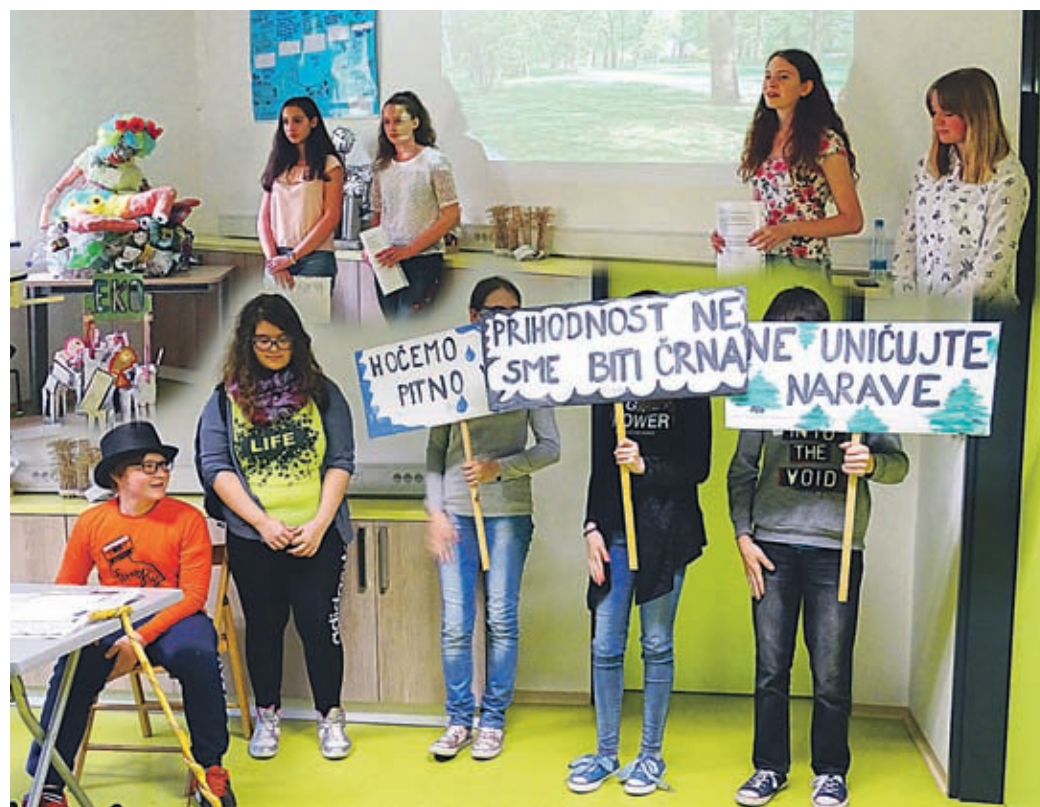
Šaleški osmošolci niso bili inovativni le pri izdelavi predlogov za spominska obeležja velikega ekološkega protesta, ampak tudi pri predstavitvah.