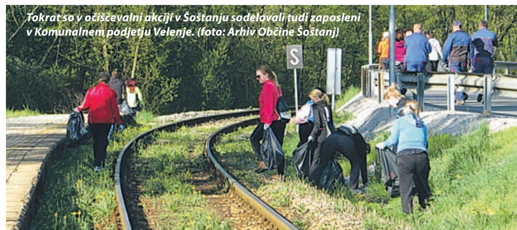
Tokrat so v očiščevalni akciji v Šoštanju sodelovali tudi zaposleni v Komunalnem podjetju Velenje.

Čestitamo ob dnevu upora proti okupatorju – 27. aprilu, prazniku dela – 1. maju in dnevu zmage – 9. maju.