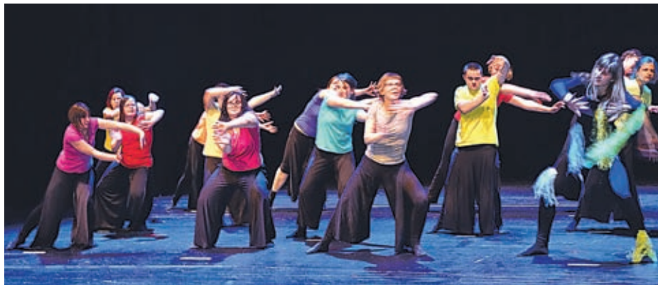
Plesna skupina velenjskega centra je na odru Doma kulture v Velenju je navdušila.

ljem sprejela pokroviteljstvo nad revijo, saj je center s svojim delom, trudom in požrtvovalnostjo opravičil svoj obstoj. Občina pa je s tem znova potrdila svojo odprtost do različnih kultur, ljudi in še česa.