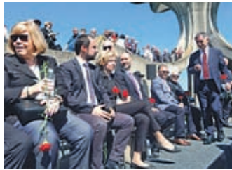
V Jasenovacu je potekala žalna slovesnost v spomin na žrtve.

V nekdanjem koncentracijskem taborišču Jasenovac na Hrvaškem