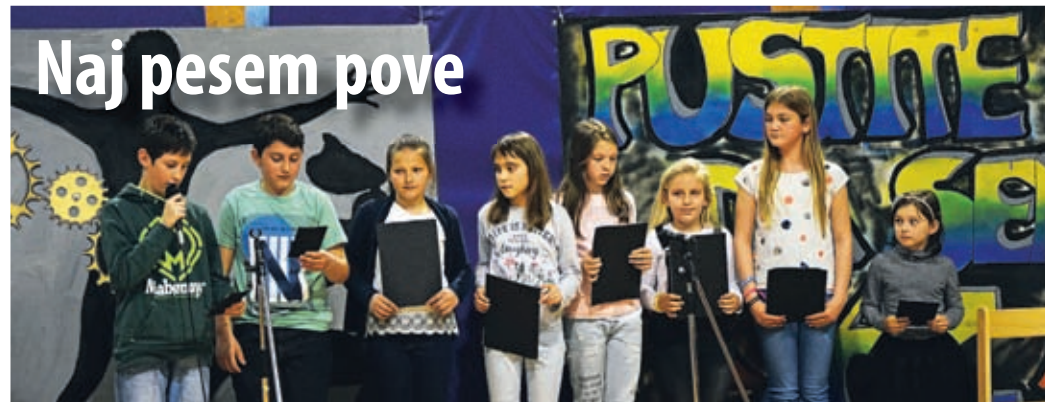
Učenci s s predstavitev svojih pesmi pokazali, da občutek za kulturno ustvarjanje še živi.

Planinci so se po skupščini odpravili še na ogled usnjarskega muzeja in drugih znamenitosti Šoštanja. ■