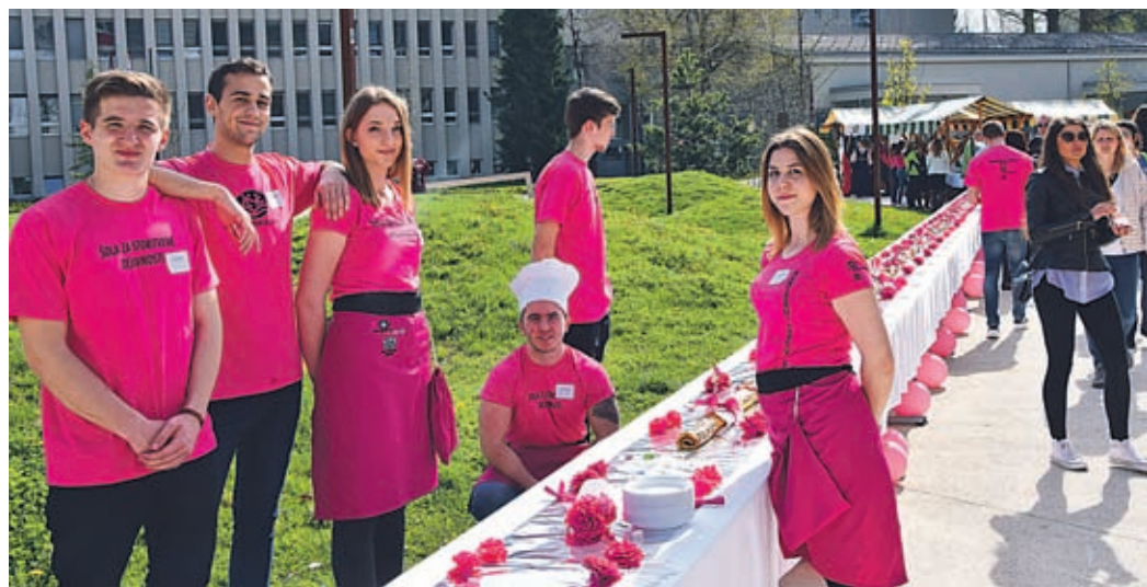
Dijaki so bili ponosni, ko so rezali rolado dolginko (ki ji na fotografiji, kar ni videti konca).

Že tretje leto zapored so se na velenjski Šoli za storitvene dejavnosti letos odločili, da dijakom zaključnih letnikov omogočijo zares praktično izkušnjo zaključnega izpita. Minulo sredo so tako pripravili Karierni izziv 2018, z izvedbo katerega so dijaki opravili del zaključnega izpita pri praktičnem predmetu. Zares so bili delavni. Velenjsko promenado so napolnile stojnice, na katerih se je bilo možno nagledati raznovrstnih dobrot, si priskrbeti bone za konkretne užitke v razstavljenih dobrotah, se igrati in izobraževati ob grajskih igrah, se fotografirati, prisluhniti glasbi in tudi videti 20 metrov dolgo »rolado dolginko«. Ta je bila novost letošnjega kariernega izziva, zanj pa so porabili kar 380 jajc, 10 kg moke, 10 kg sladkorja in seveda še nekaj ostalega materiala. Mimoidoči so si ji ogledovali, se fotografirali ob njej in se večinoma odločili tudi, da jo poskusijo.