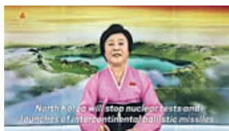
Severna Koreja je sporočila, da bo prenehala testirati jedrsko orožje.

Severna Koreja je izrazila pripravljenost za popolno jedrsko razorožitev in za to ni postavila nobenih pogojev.