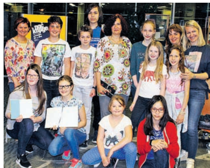
Ob svetovnem dnevu knjige so v za mlade pripravili Nočni lajf v knjižnici.

Ob svetovnem dnevu knjige pa so v velenjski knjižnici poskrbe-