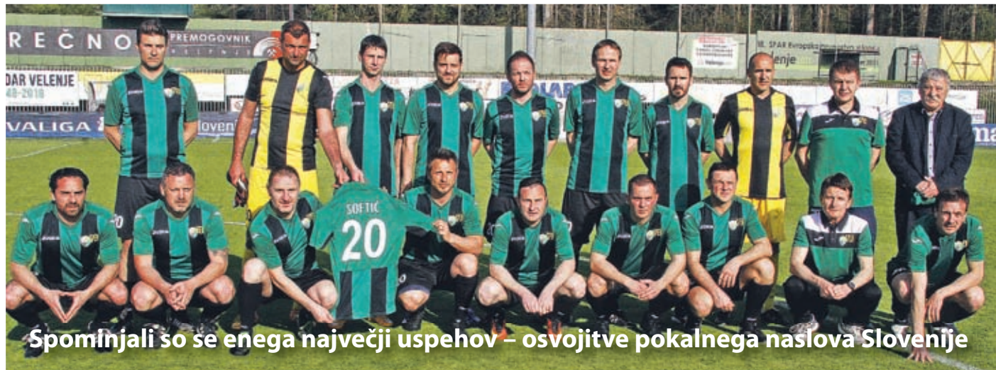
Spomnili so se enega največjih uspehov – osvojitve pokalnega naslova Slovenije

Zelo veselo, praznično je bilo v sredo prejšnji teden na mestnem stadionu v Velenju. Tekmovanje Rudarja v prvi ligi letos mineva tudi v znamenju 70-letnice obstoja kluba. Ob tem jubileju bodo pripravili več prireditev. V sklop praznovanja je sodil tudi dogodek, s katerim so se spomnili doslej enega največjih uspehov v zgodovini kluba, osvojitve naslova pokala Slovenije pred dvajsetimi leti.