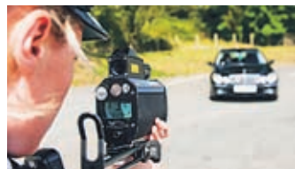
Policisti so hitrost v prometu preverjali na več kot 600 lokacijah po državi.

Policisti so med tekom celega dne merili hitrost voznikov na 617 lokacijah po vsej Sloveniji.