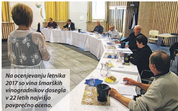
Na ocenjevanju letnika 2017 so vina šmarških vinogradnikov dosegla v 22 letih najvišjo povprečno oceno.

Po besedah sogovornika so rezultati letošnjega ocenjevanja pokazali, da je letnik 2017 za šmarške vinogradnike odličan. Prva stopnička za vrhunska kakovost je 18,10, pravi Vodovnik, dosežena povprečna ocena za letnik 2017 18,19 pa je toliko nad njo. Pozna se, da društvo organizira vsa izobraževanja, povezana s pridelavo grozdja in uživanja vin. Če nekdo pozna te stvari, lažje doseže cilj, saj zna bolje izkoristiti strokovne zakonitosti v vinogradu in kasneje v kleti. »Šmarški vinogradniki naj le na tako daljujejo.«