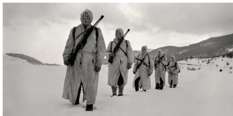
Partizanska izvidnica v belem, Babno polje, 1944.

Razstava prikazuje izbor Šelhausovih posnetkov iz štirih obdobj njegovih delovanja: iz druge svetovne vojne, tržaškega obdobja, obdobja med letoma 1958 in 1972 in časa po letu 1972. Med drugo svetovno vojno je Edi Šelhaus kot partizanski fotoreporter od leta 1944 do osvoboditve maja 1945 posnel dragocene verodostojne dokumente časa, predvsem življenja v zaledju, med njimi tudi prihod partizanov v osvobodjene Trst, Gorico in Ljubljano ter proglasitev prve povojne slovenske vlade v Ajdovščini. Po vojni je do leta 1955 živel v Trstu, kjer je med letoma 1945 in 1948 kot filmski snemalec predvsem na območju cone A za slovenski Filmski obzornik in jugoslovanske Filmske novosti posnel aktualne dogodke nemirnega časa, ko se je odločalo o meji med Jugoslavijo in Italijo. Kot fotoreporter je takrat sodeloval tudi s časopisoma Primorski dnevnik in Il Lavoratore. Po letu 1948 je kot priložnostni fotograf beležil predvsem vsak-