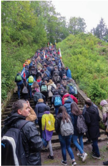
Simbolični vzpon po 186 stopnicah smrti iz kamnoloma Wienergraben k taborišču

Dr. Monika Kokalj Kočevar, muzejska svetnica