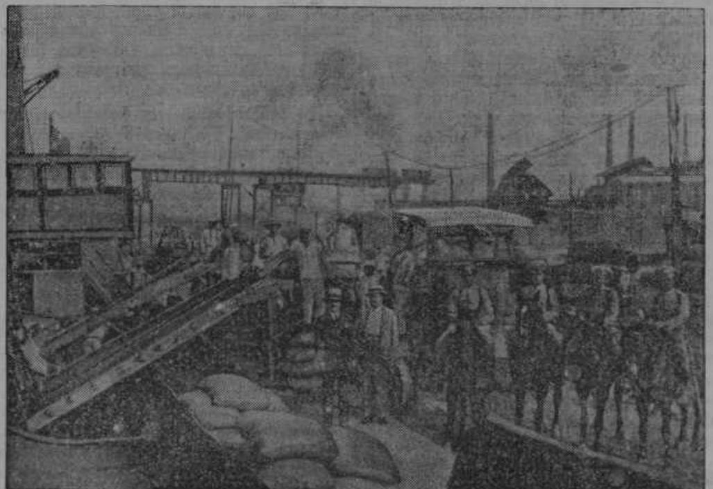
Bogatom braziljanskim farmerjem v Južni Ameriki je preostalo od lanskega leta 13 milijonov vreč kave, katero mečejo sedaj v morje radi tega, da bi ne padle cene letošnjemu pridelku.