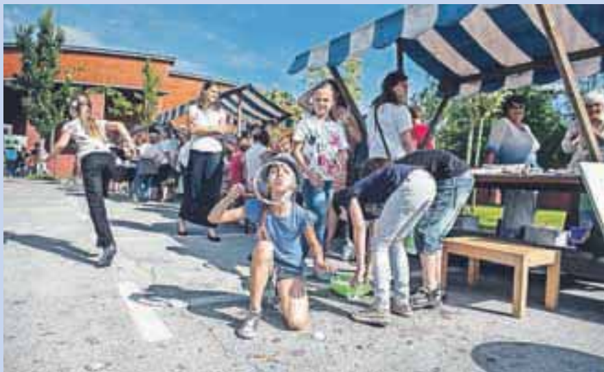
Letošnja tržnica znanj v Medvodah je bila še bolj pisana kot lani.

V Medvodah so se letos že drugo leto pridružili festivalu Teden vseživljenjskega učenja. Osrednji dogodek je predstavljala Tržnica znanj, ki so jo pripravili konec junija.