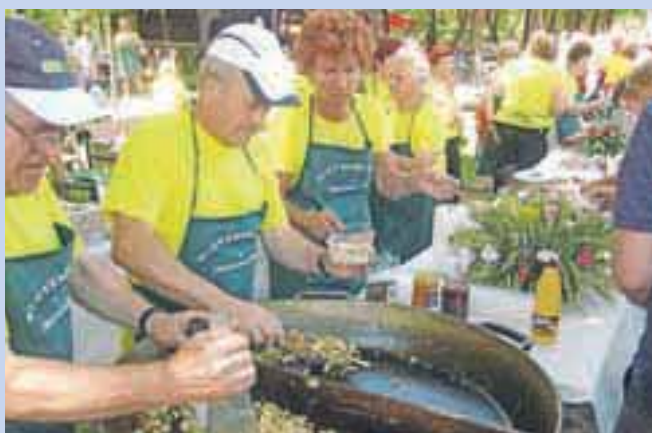
»Šmorn« je šel v slast mladim in starim.