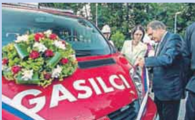
Zbiljski gasilci so bogatejši za novo vozilo za prevoz moštva.