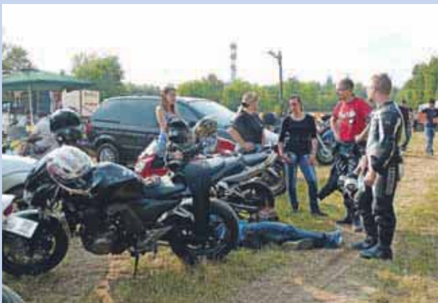
Motoristi in njihovi prijatelji so se tudi letos zbrali na sedaj že tradicionalnem pikniku.