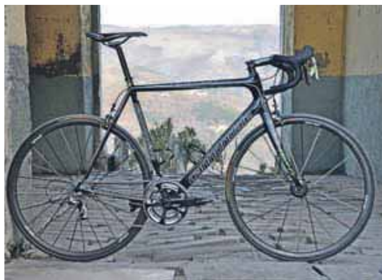
... različica, ki ga vozi uredništvo Sotočja.