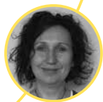
Majda Pur Osnovna šola Polzela