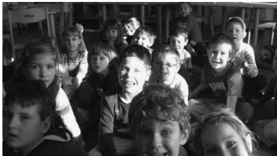
Slika 6: Pripravljani na pravljico