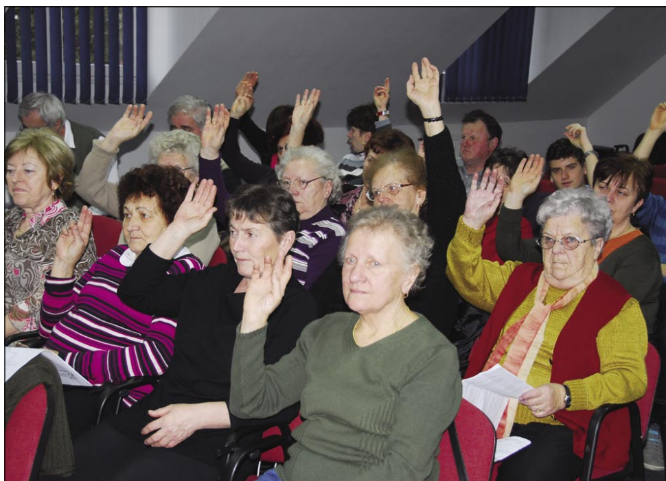
Občni zbor glasuje

Že so uvedli in bodo uvedli določene varčevalne ukrepe, ki bodo vplivali tudi na naš proračun. Zato bo morala tudi naša organizacija sprejeti varčevalne ukrepe in pripraviti tudi proračun za slabše čase,« je povedal predsednik Hirnök.