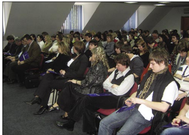
Konferenčna dvorana Slovenskega doma nabita s srednješolci