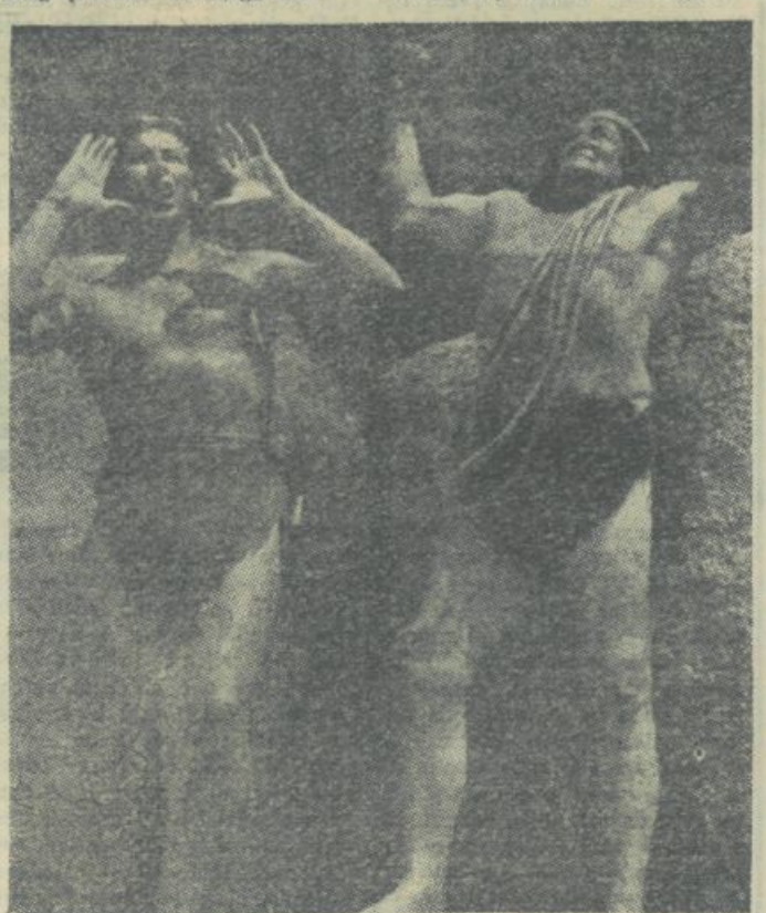
...ali divja sprostitost Tarzanove džungle...

Razmah predejavov po nadzoru nad vplivom filma na mladino doseže doslej svoj višek v drugi polovici letošnjega leta.