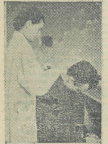
Alli je vse v redu?