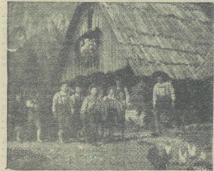
...ali prijetno vzdusje mladinskega filma?

telji in člani »Centra filmologije« zastavili nalogo, znanstveno preučevati sodobno stanje filma na svetu in pa vpliv vsega, kar se v zvezi s filmom dogaja.