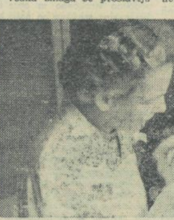
Zobna ordinacija zdravstvenega fonda na Miklošičevi cesti je vedno polna pacientov — študentov in študentk

Zlagam kartone kot raztepe-ne igrane karte po zgubljeni