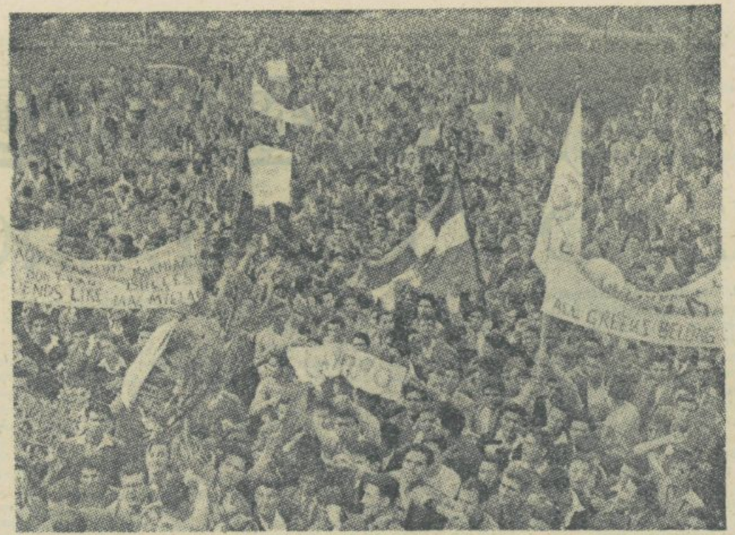
Atenski študentje se na množičnih manifestacijah odločno zavzemajo za to, da bi Angleži zapustili otok Ciper...