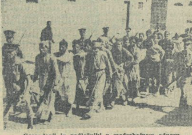
Gospodari in podložniki v medsebojnem odnosu...