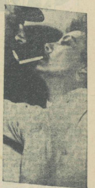
Prizori, ki svietejot...

Akcija naše široke začete družbene dejavnosti v smer preučevanja vplivov filma na mladino in intenzivnejšega vključevanja do brega igranega in poučnega filma v naše življenje naj bi bila zato usmerjena predvsem na naša reproductivna in produktivna filmska podjetja, ki naj bi posledje po-