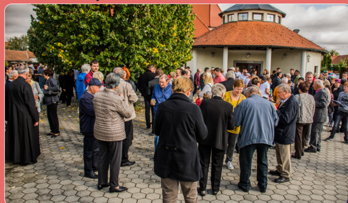
Mašni slovesnosti je sledila zakuska v organizaciji ŽPS in župnijske Karitas.