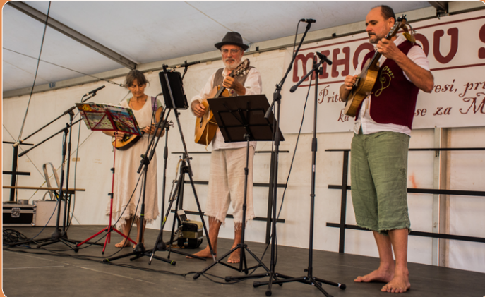
Slovesnost so z glasbenimi vložki obogatili člani Moške vokalne skupine KD Slavko Osterc Veržej in gostje od Sv. Jurija ob Ščavnici, skupina BOS.