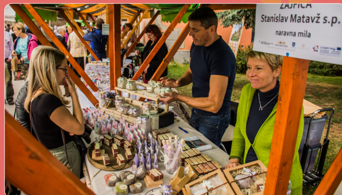
Ponudba rokodelskih centrov, ki delujejo širom Slovenije, je bila tudi letos pestra.