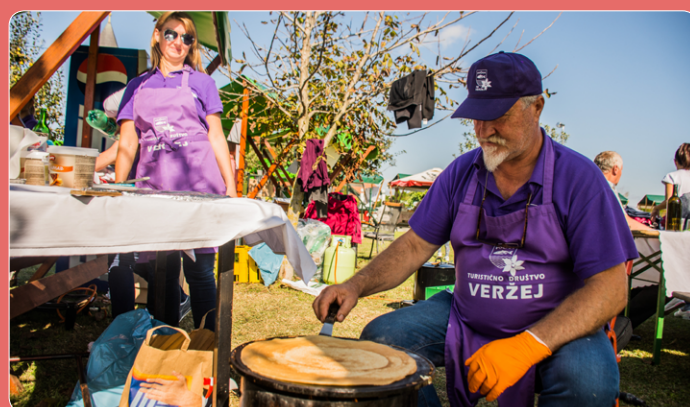
... in nekatera veržejska društva.