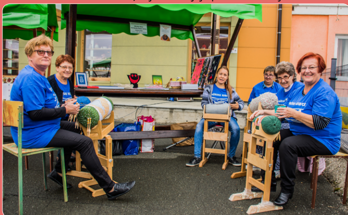
Na osrednjem delu sejma so se predstavili rokodelci in ponudniki, ki so vključeni v znamko KULTNATURA (Interreg SI-HR 2014-20), ki so ob stojnicah tudi prikazovali potek dela.