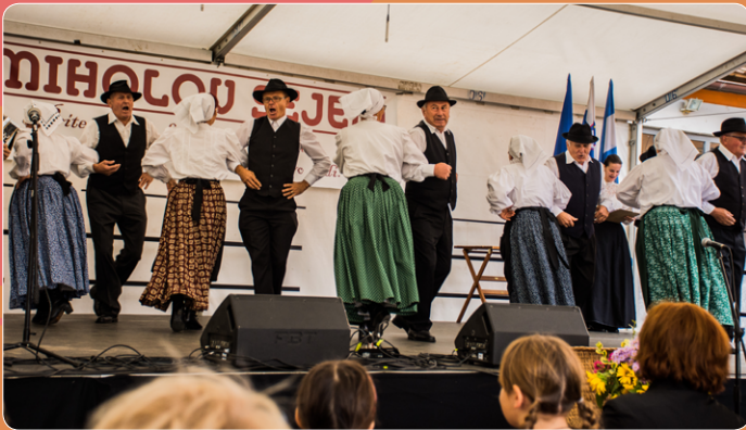
Sejemski oder pa je najprej gostil folklorne skupine, ki so se udeležile letošnjega blagoslova.