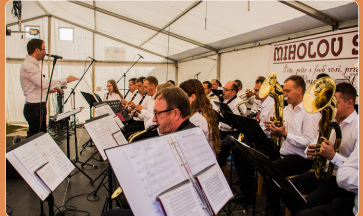
Tudi godbeniki KUD Muzika iz Križevcev pri Ljutomeru niso manjkali.