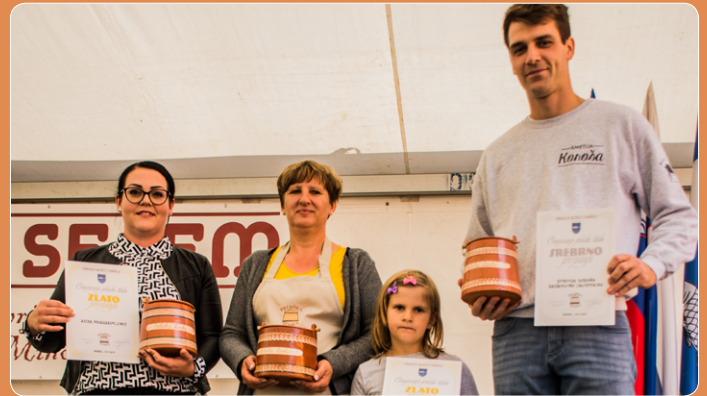
Sledila je podelitev nagrad najboljšim v tekmovanju za Najprleško tunko, tudi letos je ta čast pripadla kmetiji Vargazon s Cvena.