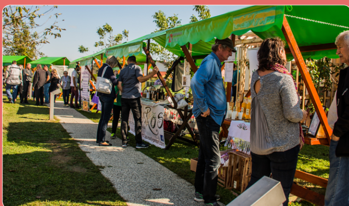
Letos še posebej lepo urejen kamp so zasedli lokalni ponudniki ...