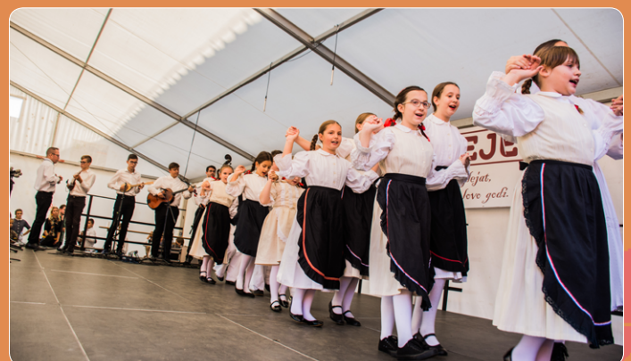
Vrhunec letošnjega kulturnega programa je ponudil MiHeC fest, ki je poleg domačih folklornikov gostil še otroke od Male Nedelje, člane KUD Študent iz Maribora, za mednarodno udeležbo pa so poskrbeli člani folklorne skupine »Sončece« iz Varaždina.

Ob koncu bi se radi v imenu organizatorjev zahvalili vsem, ki ste kakor koli pripomogli, da je sejem uspel tako, kot smo si zastavili. Brez številnih prostovoljcev in članov društev, ki ste sodelovali pri pripravah in pospravah sejma, bi bilo veliko težje. Še posebej pa velja izpostaviti člane PGD Veržej, ki so tudi letos poskrbeli, da so bile stojnice na mestu in smo sejem varno pripeljali h koncu. Ko vsi stopimo skupaj, je sejem resnično »naš«.