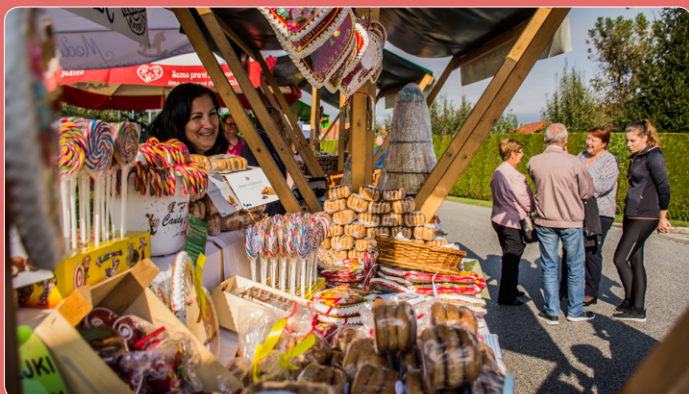
Pomurski rokodelci so ponujali tradicionalne izdelke, kot so medenjaki ter sodobne rokodelske izdelke, ki jih izdelujejo predvsem mlajši rokodelci.

Miholov sejem je letos doživel osmo izdajo, odkar smo ga obudili. Odločitev, da na stojnicah damo osrednje mesto rokodelstvu – tako domačim rokodelcem, ki delujejo v Pomurju, kakor tudi rokodelcem iz drugih koncev Slovenije – se je izkazala za pravilno, sej to daje Miholovemu sejmu unikatnost, ne le v lokalnem okolju, pač pa tudi širše. Ko k ponudbi kvalitetnih izdelkov domače izdelave dodamo še lokalno kulinariko, se zdi, da smo sestavili dobno kombinacijo. Letos se je tako na Miholovem sejmu predstavilo čez 60 ponudnikov, ki so naredili sejem živ. Miholov oder so polnili številni nastopajoči, ki so poskrbeli, da obiskovalcem ni bilo dolgčas.