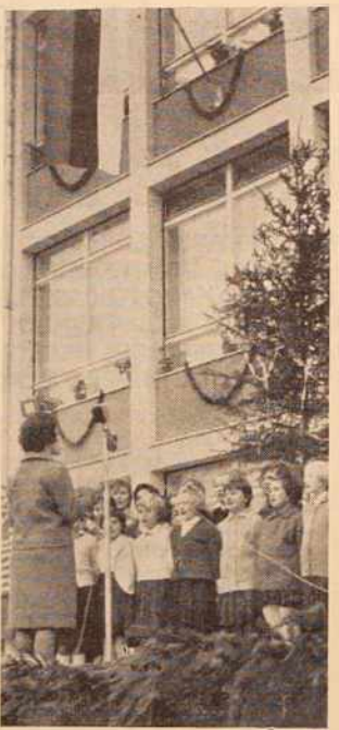
Pred novo šolo so vedro zapeli mladi dobrovniški pevci

Za prve potrebe so društva dobila od Občinskega ljudskega odbora dotacijo v znesku 1.200.000 din. Ta je v letošnjem letu vsekakor primerna, saj so društva dobila poleg tega letos še pol milijona za knjižnice, za ureditev prostorov pa so porabili več kot 17 milijonov. Novi prostori »Svobode« bodo lahko služili širokemu krogu kulturno-prosvetnih delavcev tako iz Sobot, kakor tudi iz okolice. Sem bodo lahko prihajali gostovat in prisostvovati predstavam naših osrednjih kulturnih skupin.