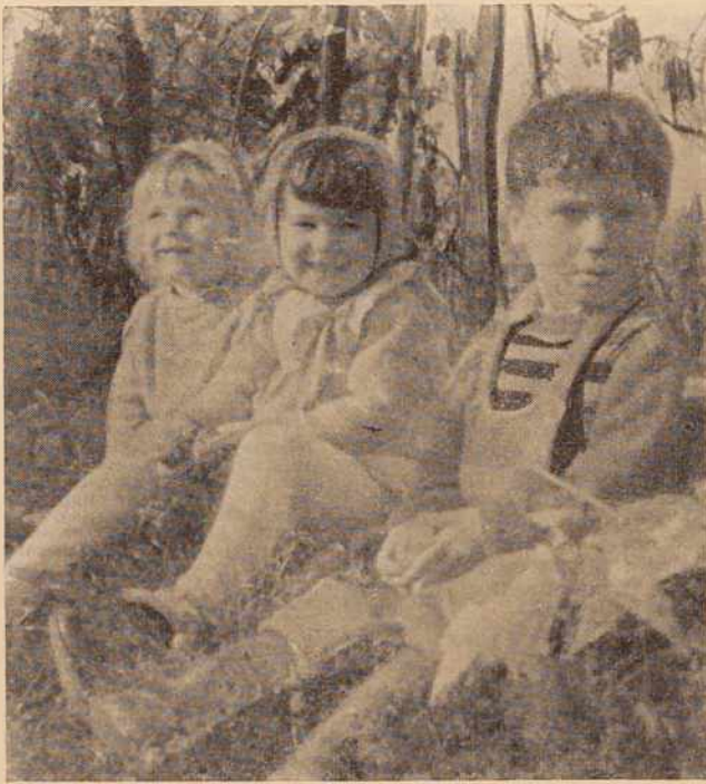
Kar ob robu vinograda so posedli, da bi ujeli malo sonca

ali avtomobilom, KI JE LAST PODJETJA. Na čigave stroške gre do takih prevozi, je vprašanje. Včasih stoji tak avtomobil na terenu tudi po dva, tri dni. V vsakem primeru to nekdo plača in (ker je zelo verjetno, da nosi take stroške podjetje) zaradi velikega števila teh nakupnikov odplava po tej krompirjevi reki LEP KUP DRUŽBENIH SREDSTEV! Če kolektiv mislijo na to, ni njejihova zadeva, pač pa ZADEVA NAS VSEH. Zato, pa še zaradi ostalih problemov, ki jih povzročajo tovrstno kupovanje in prekupčevanje, je SKRAJNI ČAS, DA NEKDO POSEZE VMES IN KONCA TO ČRNO BORZO S KROMPIRJEV.