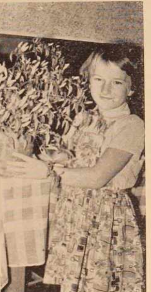
Pri Rajnarjevih na Razkrižju smo posneli tole svojevrsno zanimivost: feteroni kot nageljni...