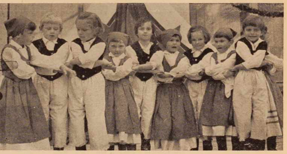
V nedeljo v Dobrovniku - V kulturnem sporedu so nastopili tudi cicibani.