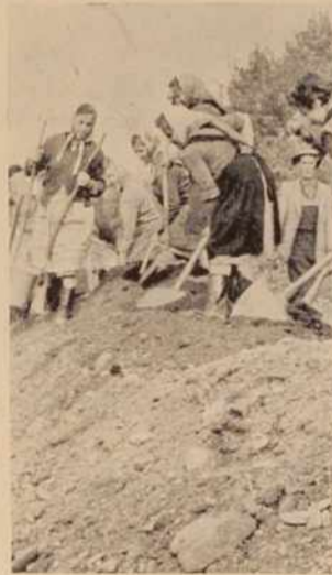
Pri gradnji ceste občasno sodelu- jejo ljudje s področnih vasi

Tako bodo v Brezovcih dobili nekaj, kar je bila že davna želja vseh vaščanov in ki jo je izpolni- la s svojim delom prav mladina.