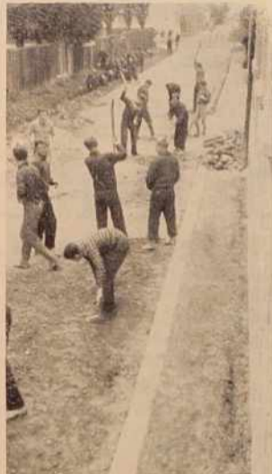
Mladina pri delu

stalih specializiranih mladinskih organizacij, kot so to n. pr. Počitniška zveza in tabor- niki, v katere je sedaj vklju- čena v glavnem le srednješol- ska mladina in katerih delo- vanje bo potrebno v bodoče prenesti tudi med kmečko in delavsko mladino. Tudi o za- bavah, ki jih prirejajo posa- mezna društva po vaseh, so precej razpravljali in ugotovi-