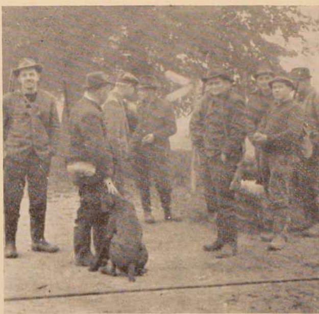
Lovska družina v Ljutomeru je v nedeljo priredila prvi letošnji jesenski lov. Kakor smo zvedeli, je bil uspešen, saj so postrelili veliko število fazanov. Drugi veliki lov bodo imeli proti koncu me- seca. Takrat bodo lovili tudi zajce.

Ob zaključku plenuma se je razvila tudi živahna razprava udeležencev, ki jo je vodila predsednica Okrajnega odbora SZDL o predosnutku nove us- tave.