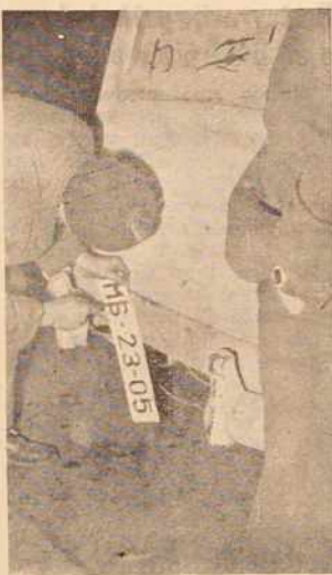
Ce je vozilo v zares nemogočem stanju, se gre drugače kot tako.

Zadruga so skušale držati čim realnejšo ceno sadja. To jim je uspelo tako dolgo, dokler se niso pojavili na terenu najrazličnejši nakupovalci in prekupčevalci, ki so pod firmo sindikatov in drugih z neodgovornim nakupovanjem in barantanjem višali cene. Taki prekupčevalci so navadno prišli do proizvajalca po poznavstvih in sorodniških zvezah. Ko