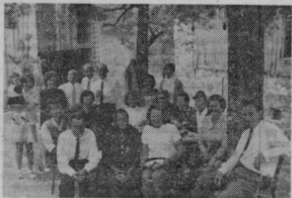
Takole so se zbrali otroci ob njeni osemdesetletnici, ki jo je praznovala letos maja.

smejala se mi je, mi povedala, da je to ona ter me povabila v hišo.