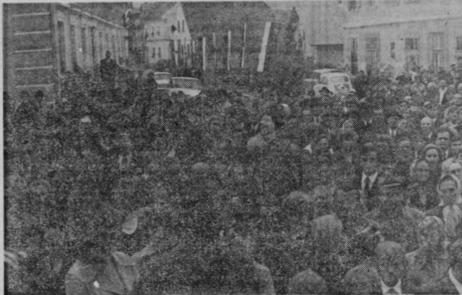
Sentjurčani so znali pozdraviti svoje Ipavce

NE ZAMUDITE! PRIHODNIČ BELE TULPIKE LJUBEZENSKI ROMAN, KI VAM GA POKLANJA AVTOMOTOR