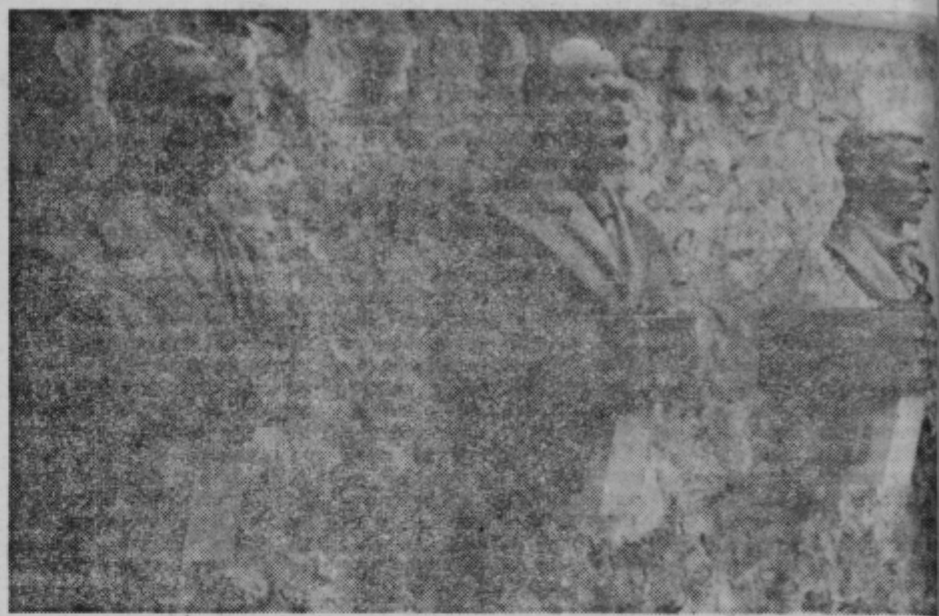
Nikoli ne bodo pozabljeni

Svečanost je odprl član upravnega odbora sklada za postavitev spomenikov, MIR-