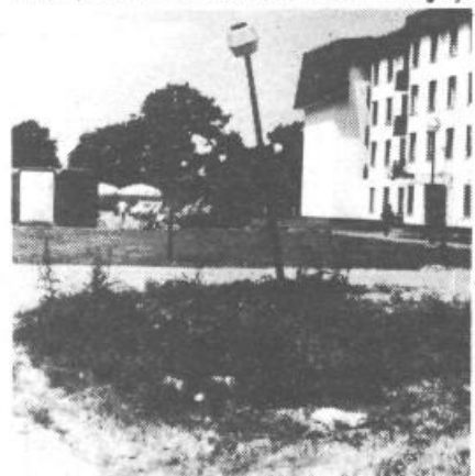
še danes viden, ker po globokih kolesnicah še ni zrastle trava.

Ta (ne)kulturni odnos do narave in okolja je