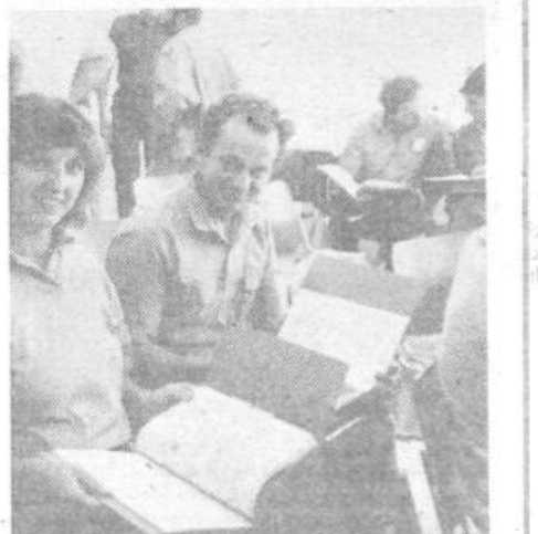
Barjanski kmetje so z velikim zanimanjem proučili skripto »Sodobna tehnologija pridelovanja poljščin«

Prvi korak v vstopanju tega centra v ljubljansko javnost so storili sredi julija, ko so ob prisotnosti predsednika izvršnega sveta mesta Ljubljane, združenih kmetov, družbeno-političnih delavcev in strokovnjakov s področja kmetijstva in živilstva naredili prvo potezo pri urejenju projekta SODOBNA TEHNOLOGIJA PRIDELOVANJA POLJŠČIN. Prednost so dali koruzi, pšenici, krompirju, ogrščici in strniščnim dosevom. Okrog 150 kmetov iz barjanskih vasi je prejelo publikacijo, ki jim bo omogočila štiri leta spremljati dela na polju, strokovnjakom pa na osnovi njihovih zapiskov uspelo izračunati gospodarnost in donosnost njihovega dela. Lično izdelano in pregledno zapisano skripto so pripravili Kmetijska zadruga Ljubljana, Biotehniška fakulteta VTOZD za »agronomijo in SIS za