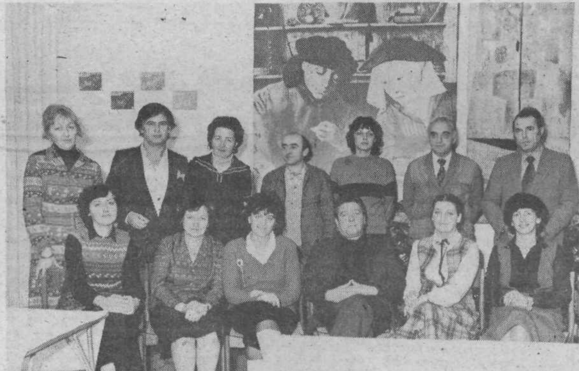
Mešani pevski zbor Ljubljanske banke v manjši zasedbi