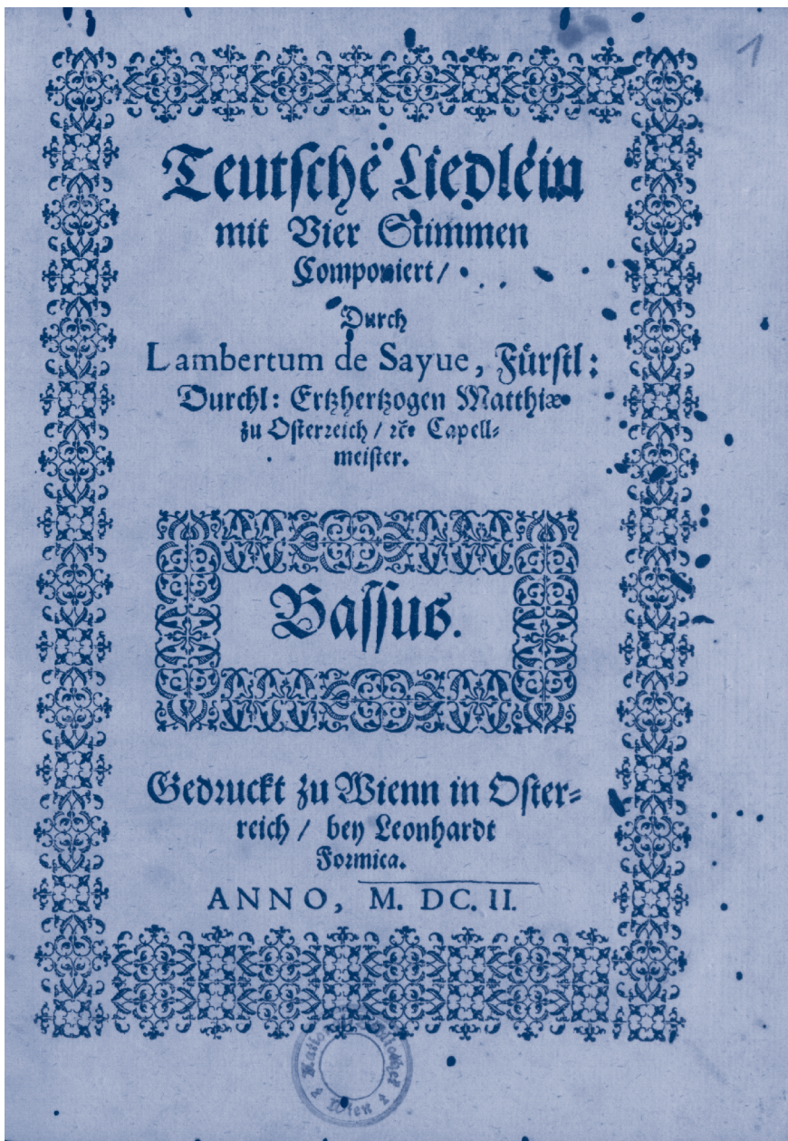
Abbildung 4: Lambert de Sayve, Teutsche Liedlein von 1602, Bassus, Titelseite, Österreichische Nationalbibliothek Wien, Musiksammlung, SA.79.C.30/4 20 Mus (mit Genehmigung).