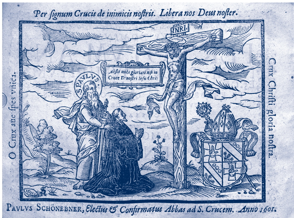
Abbildung 3: Blasius Amon, Introitus Dominicales von 1601/02, Tenor , fol. 1v, Bayerische Staatsbibliothek München, Musiksammlung, 4 Mus.pr. 151 (mit Genehmigung) .

Die Widmung erwähnt die siegreiche Schlacht des Erzherzog Matthias gegen die Türken bei Alba Regalis (Stuhlweißenburg, Székesfehérvár), die im September 1601 stattgefunden hat. Der Druck ist also entweder gegen Ende des Jahres 1601 oder Anfang 1602 fertig gestellt worden. Für das Jahr 1602 spricht auch die Angabe, Blasius Amon sei vor zwölf Jahren verstorben (gest. 1590). In der umfangreichen Dedikation liest man ferner von einer lebendigen Musikpflege der Vokal- und Instrumentalmusik im Stift Heiligenkreuz. Der Herausgeber erwähnt, die Werke seines Bruders seien ebenda häufig gebraucht worden und der Abt sei auf diese sehr bedacht gewesen. Stephan Amon führt ferner an, er selbst habe den Druck der ihm hinterlassenen Sammlung veranlasst und korrigiert. Dennoch ist er recht fehlerhaft ausgefallen. Dem Druck ist noch ein umfangreiches Gedicht – ein Carmen elegiacum mit der Überschrift Ad lectorem – sowie zwei Verse In Zoilum vorangestellt.