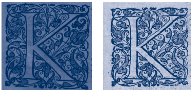
Abbildung 1: Initiale K in Blasius Amon, Missae aliquot (1588), Altus , fol. 16v, Wienbibliothek im Rathaus, Musiksammlung , M 5231 und Narcissus Zängl, Cantiones sacrae (1602), Discantus , fol. 1r, Bayerische Staatsbibliothek München, Musiksammlung , 4 Mus.pr. 154, Beib. 2 (mit Genehmigung).

Formica. Sämtliche Anfänge der Kompositionen sind mit verzierten Initialen versehen, während bei Apffl nur die Anfänge der Kyrie-Sätze auf diese Weise gestaltet sind. Es fällt aber auf, dass die Drucktypen von Apffl und Formica einander entsprechen. Das ist insbesondere bei den identischen Stempeln für die Initialen auffallend (Abbildung 1).