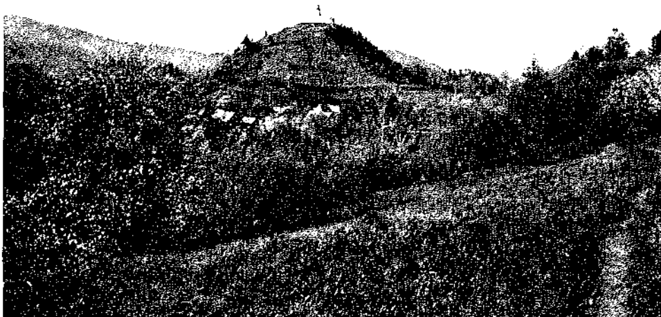
Pogled s Katarine proti Sv. Jakobu