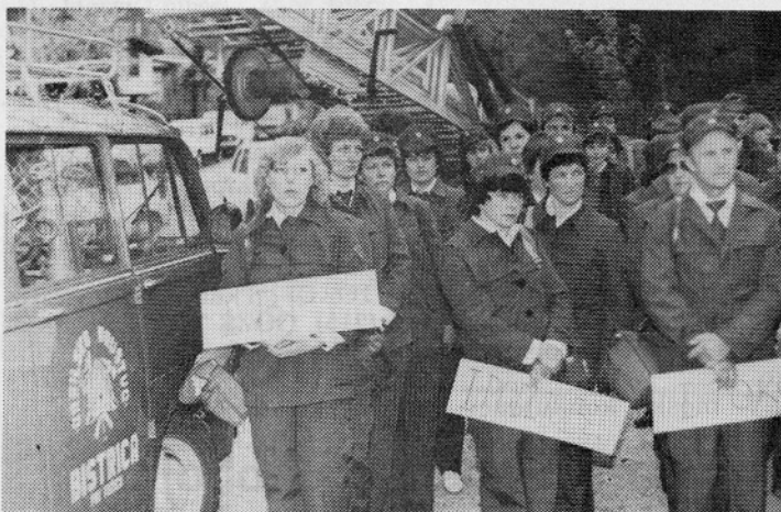
Zbor ekip pred tekmovanjem

Letošnje tekmovanje ekip prve pomoči je bilo v Bistrici, udeležilo pa se ga je 26 ekip. Najboljša je bila ekipa iz Podljubelja pred Jelendolom in Lepenko. Naša prva ekipa je zasedla peto mesto, druga ekipa pa je bila sedemnajsta.