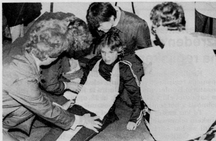
Izvajanje nudenja prve pomoči so ocenjevali za to usposobljeni kadri

Kordinacijski odbor za SLO in DS pri OK SZDL