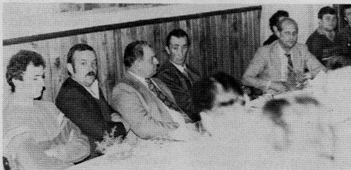
Svoj občni zbor so imeli tudi člani društva tekstilnih mojstrov, ki so ocenili opravljeno delo ter se dogovorili o bodoči aktivnosti