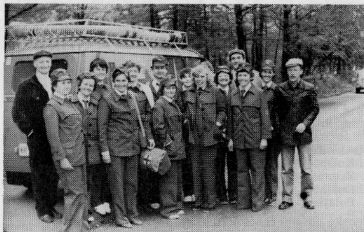
Ekipa BPT po končanem tekmovanju