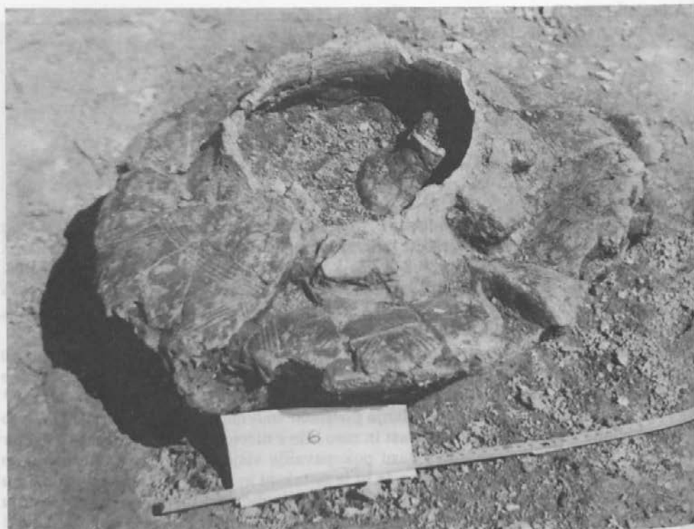
Sl. 1: Ormož, grob 6.