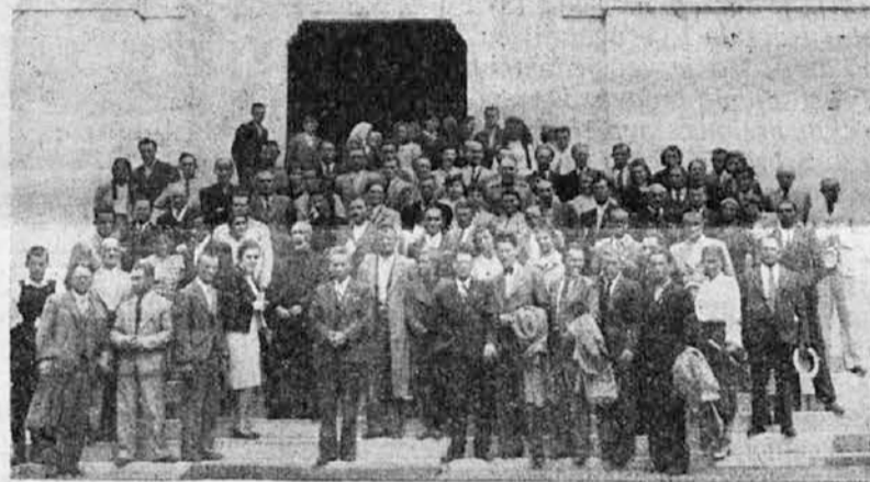
Učesnici sa svojim nastavnicima pred Oplenačkom crkvom.