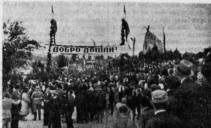
Ogromna masa sveta na Ceru, u pozadini spomenik palim Herojima