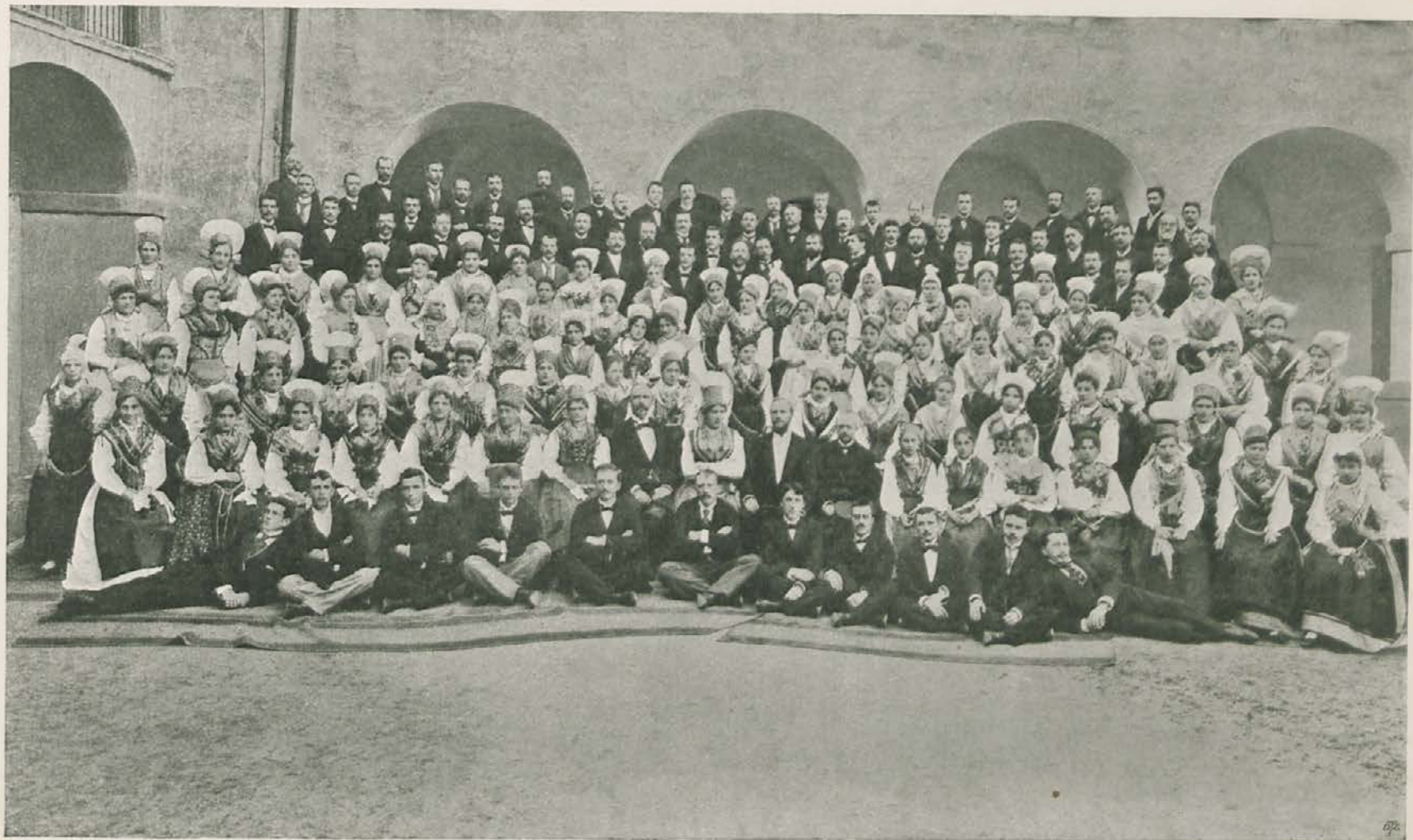
ZBOR GLAZBENE MATICE IZ LJUBLJANE (ŽENSKI ZBOR U NARODNOJ SLOVENSKOJ NOŠNJI.)