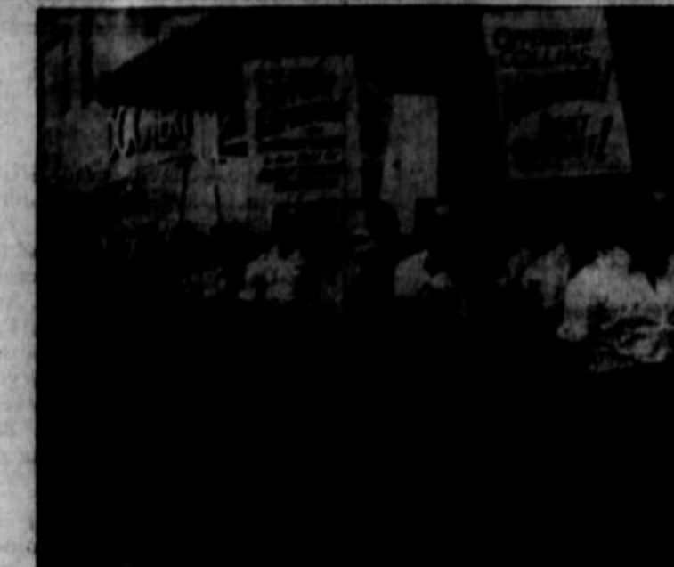
Slika s piketne straže pred veletrgovino Oppenheim Collins Dept. Store v New Yorku. Stavka je nastala, ker se je uprava izgovarjala na "red bathing" namesto v pogajanje za sklenitev nove pogodbe. Stavkarjem je prišlo na pomoč več tisoč članov unije CIO.

ognilo. Znano vsekakor je, da na področju raketnih letal Rusija nič ne zaostaja za Ameriko ali Anglijo, ako ne prednjači. Ne gre torej samo za usodo vse Evrope, marveč tudi za usodo Amerike in Rusije. Sigurno je tudi to, da v tem konfliktu ni takih problemov, da bi jih ne mogli rešiti okrog zelene mize, ako na obeh straneh posodujejo voljo za mirno izravnavo spornih vprašanj.