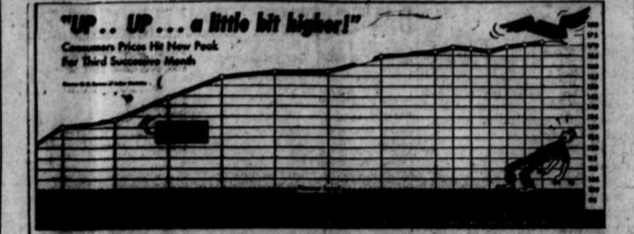
Ta statistična skica kaže naraščanje cen po odpravi OPA. Bazirana je na statistiki slovenskega delavskega departamenta.

vse živo. Grapar je nalašč napravil majhen ovinek, da bi ga oni ne zapazili, zraven pa go-drnjal: "Norci, še v nedeljo ne dajo miru." V vlakcu se je Grapar stisnil v kot k oknu in neprestano gledal skozenj, samo da bi mu ne bilo treba govoriti. Na cesti so se dvigali oblaki prahu in še iz vozečega vlaka so se videle velike luknje, preko katerih je poskakoval mimo hiteči avto. Graparjev molk je premagovala želja po zabavljanju. Obrnil se je k debelušni sosedki, ki si je pravkar pripravljala malico.