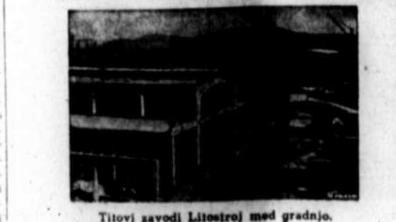
Titovi zavodi Litostroj med gradnjo.

ni prav nič maral. "Mladinska brigada" je zapihal, "ti bom že dal, smrkavec, mladinsko brigado, že tako je ponorela skoraj vsa vas. Ni jim dovolj lonec v hiši, kotel bi radi imeli. Od hiše do hiše hodijo in prosjajo, daj les, daj apno, posodi konje, zdeli pomagati, da bi jih vrag vzel in njihov zadržni dom. Samo počakaj, za lase te pripeljem domov." Jezno je pljunil po dvo-