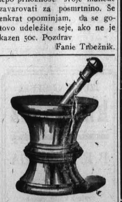
National Drug Store! Slovenska lekarna.

Slovenska lekarna. Vogal St. Clair ave. in 61. ceta. S posebno skrbnostjo izdelujemo zdravniške predpise. V zalogo imamo vse, kar je treba v najboljši lekarni. V najem se oddajo dve sobi za 4 fante, s hrano ali brez. Vprašajte na 888 London Rd. Collinwood. (64)