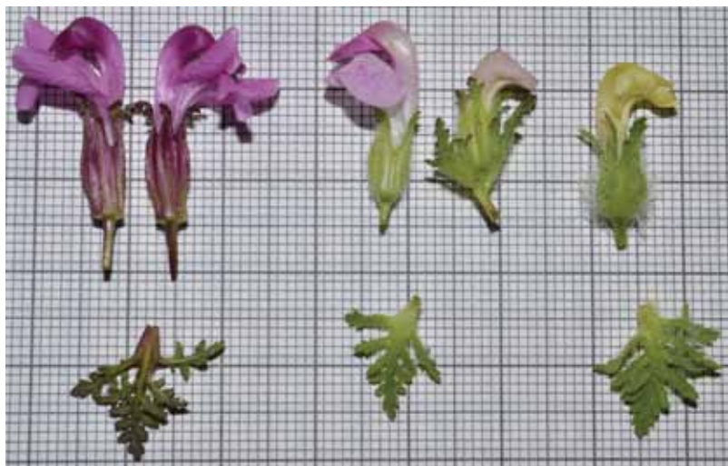
Cvetovi glavičastega (levo), julijskega (desno) in Mayerjevega ušivca (v sredini).