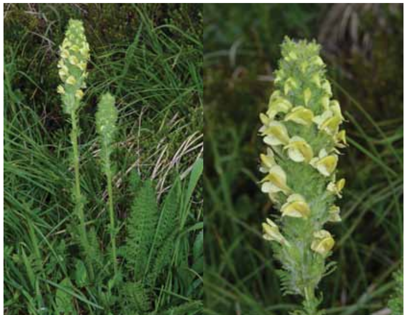
Julijski ušivec ( Pedicularis julica ) na sedlu Vrata pod Črno prstjo.

Popisoval sem sestoj združbe vednozelenega šaša in izrodne zlatice ( Ranunculo hybridi-Caricetum sempervirentis ). Blizu gruče roza cvetočih ušivcev je bila rozeta glavičastega ušivca ( Pedicularis rostratocapitata ), julijskega ušivca ( Pedicularis julica ), ki je bolj značilen za popisano združbo, pa sem tisti dan opazil šele ob poti od Vrat proti Črni prsti. Doma sem po pregledu herbarija, fotografij in literature ugotovil, da je nenavadni roza cvetoči ušivec najbrž križanec med julijskim in glavičastim ušivcem. O najdbi sem poročal svojemu dolgoletnemu sodelavcu, botaničnemu učitelju, svetovalcu, pomočniku in prijatelju Branku Vrešu. Prosil sem ga, da ime križanca vnese v našo inštitutsko podatkovno bazo FloVegSi, a še prej preveri, če je morda znano že od prej. Sam sem njegovo nahajališče obiskal še enkrat čez deset dni, dopolnil fitocenološki popis in na njem našel tudi julijskega ušivca, križanec pa je takrat že odcvetel. Po pregledu literature sva z Brankom ugotovila, da je že bil opisan križanec med podaljšanim ušivcem ( Pedicularis elongata s. str.) in glavičastim ušivcem, znanstveno ime zanj je Pedicularis x bohatschii .