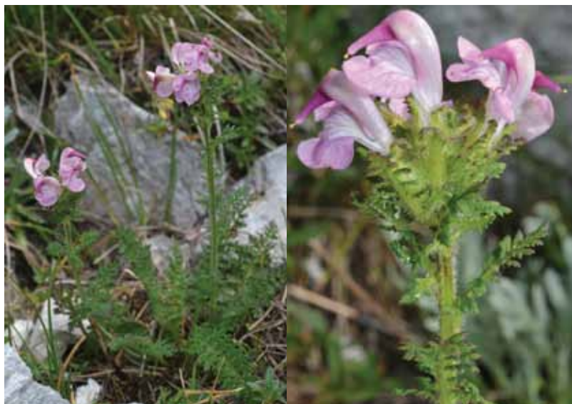
Mayerjev ušivec ( Pedicularis x mayeri ) na klasičnem nahajališču na pobočju gore Čétrt.

novega križanca podobni tistim, ki jih ima julijski ušivec, socvetje je glavičasto in po obliki v začetku cvetenja precej podobno socvetju glavičastega ušivca, vendar precej bolj podaljšano. Podporni listi cvetov so pernatodeljeni, zgornji trikripi in precej kuštravo dlakavi. Čaša je kuštravodlakava, podobna čaši julijskega ušivca. Venec je nekoliko daljši od venca julijskega ušivca, dolg do 20 milimetrov. Zgornja ustna je rumenkasta z roza kljuncem, spodnja ustna pa svetlo roza