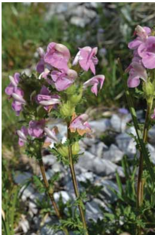
Mayerjev ušivec (Pedicularis × mayeri) pod Košutnikovim turnom v grebenu Košute.