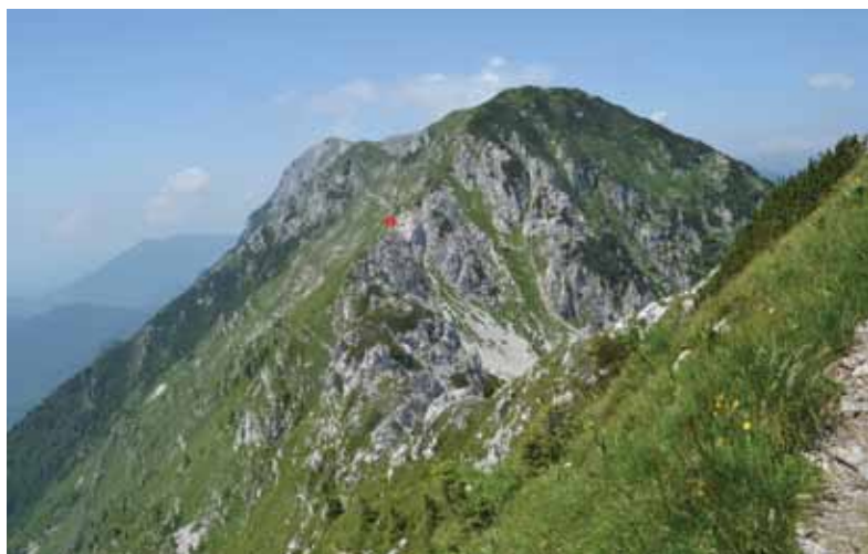
Nahajališče (rdeči krog) Mayerjevega ušivca ( Pedicularis x mayeri ) nad sedlom Vrata na pobočju gore Čétrt (slikano iz smeri Črne prsti).

Proteusu (55, 2) poročal, kako me je iskanje kratkodlakave popkorese ( Moehringia villosa ) pod Črnim vrhom nad Batavo privedlo do nepričakovanega odkritja novega nahajališča kortuzovke ( Cortusa matthioli ). 7. julija leta 2015 so bile povod za moj terenski dan po grebenu Tolminsko-Bohinjskih gora med Hohkovblom (Matajurskim vrhom) in Črno prstjo murke. Želel sem se še enkrat prepričati, ali na tem grebenu, še posebej na alpskih tratih Poljanskega in Konjskega vrha ter Čétrta, morda uspeva tudi kakšna iz skupine rdečih murk ( Nigritella rubra agg.). Pot sem zgodaj zjutraj začel v Rutarskem gozdu, se povzpел na sedlo med Hohkovblom in Poljanskim vrhom in v sončnem, a precej vetrovnem vremenu nadaljeval po grebenu proti Črni prsti. Nisem popisoval, v glavnem sem le fotografiral. Med murkami